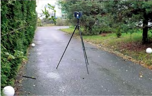
Рис. 1. Розміщення (білих) кульових опознаків для з'єднання хмари точок під час наземного лазерного сканування (НДГТКІ)

програмних продуктів, які готові працювати із цими даними, а також дають змогу проєктувати в 3D-зображенні. Порівняно із традиційними цей метод забезпечує істотну економію часу.