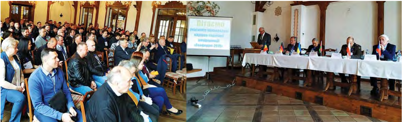
Урочисте відкриття конференції