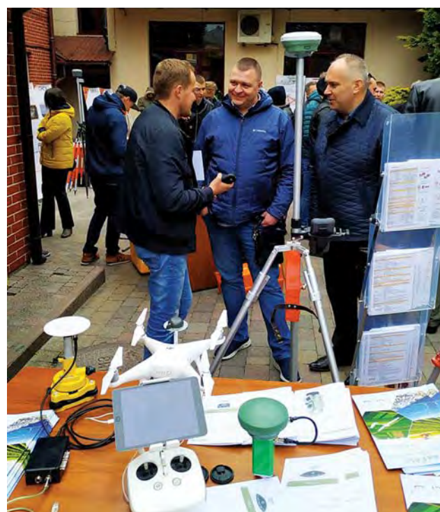
На виставці сучасного геодезичного та фотограмметричного обладнання