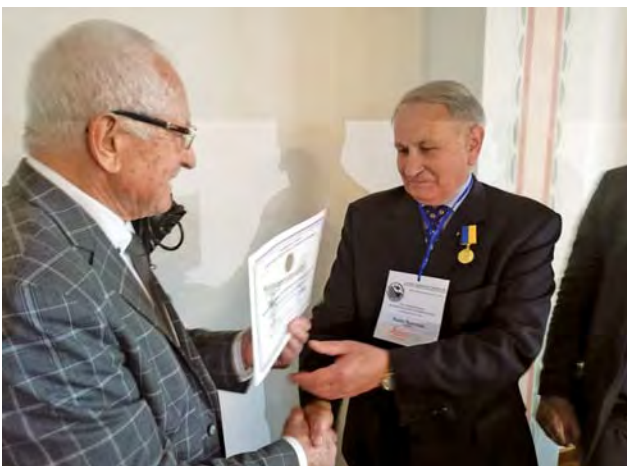
Відзнаку “Медаль ім. професора А. Д. Моторного” одержав академік НАН України Я. Яцків