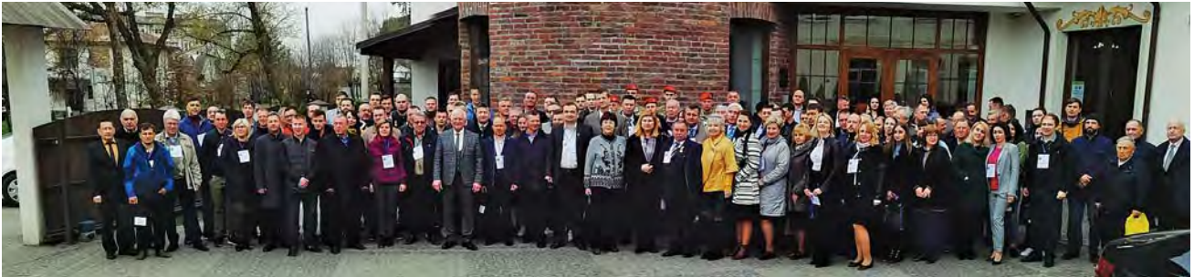
Учасники МНТК “Геофорум-2019”