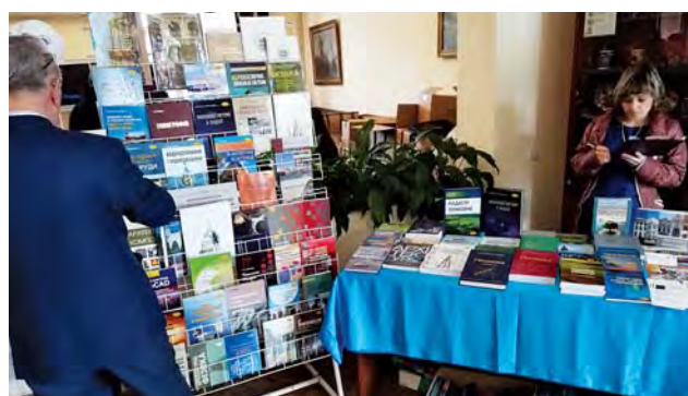
На виставці сучасної геодезичної літератури