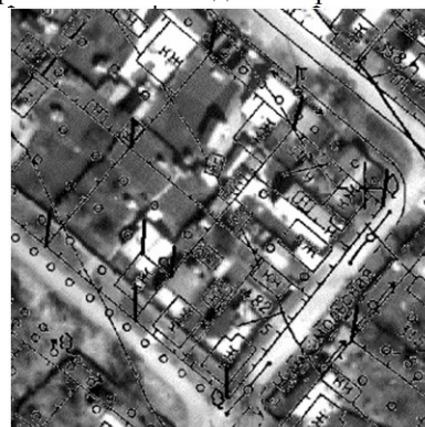
— - виміряне лінійне відхилення

Вимірювання лінійних відхилень космічного зображення і картографічного матеріалу відбувається на характерних точках (перехрестя доріг, кут огорожі, кут будинку (будівлі) та інші). Приклад вимірювань на характерних точках наведено на рис. 1.