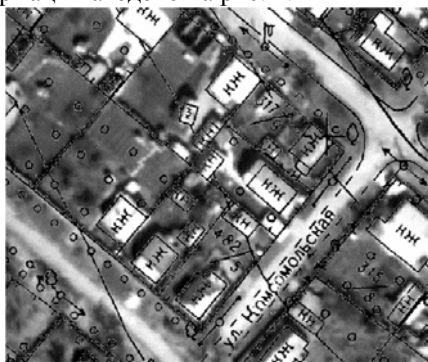
Рис.2 Приклад космічного зображення після остаточної геометричної корекції

Для інтерполяції лінійних відхилень при остаточній трансформації космічного зображення було обрано метод коллокації, бо при використанні данного методу на характерних точках не має відхилень. Приклад космічного зображення після остаточної трансформації наведено на рис. 2.