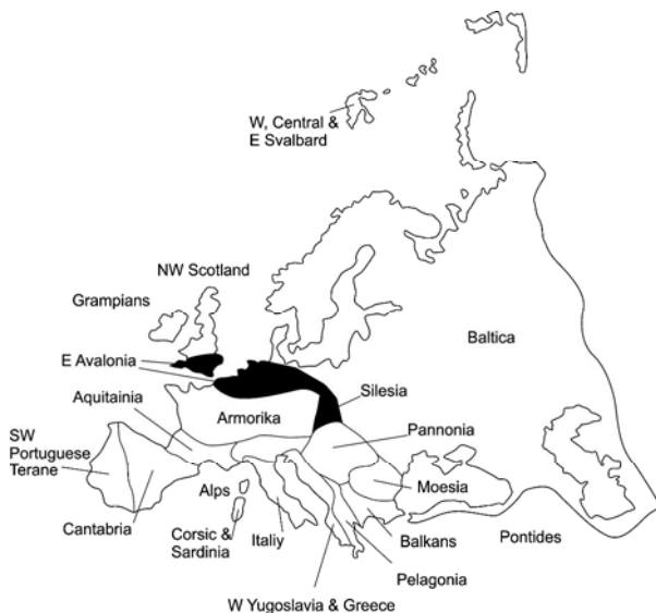
Рис. 2. Назви терейнів і їхні границі на карті Європи (А. Г. Сміт, 1993)

Сьогодні загально визнаним є твердження європейських тектоністів (Ф. Данінг, Р. Раст, Г. Гертнер, Г.-Ю. Пейх, П. Банквіцт та ін.) про те, що ні в байкальську, ні в каледонську епохи в межах цієї області варисцид жодні тектонічні структури не сформувалися. Не виділяється вже зона епікаледонської консолідації в межах Брабантського масиву, де сейсмічними дослідженнями ECORS і COCORP встановлено насув на нього варисцид, а не каледонід. Цими ж дослідженнями у верхніх шарах земної кори виділено насуви і шар'яжі. Останні знизу обмежені субгоризонтальними площинами тектонічних зривів, нижче від яких породи залягають горизонтально. А це свідчить проти моделей тектогенезу регіону, які відводили головну роль вертикальним, блоковим рухам по розломах [Проблеми...,1983]. Таким чином, у межах Західної і Центральної Європи немає тих ознак, які б давали підставу трактувати цю ділянку земної кори як "молоду платформу". І водночас, зважаючи на правило пріоритету, необхідно залишити назву, яка використовується європейськими геологами – варисциди (або герциніди) Західної і Центральної Європи.