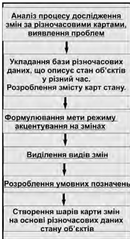
Рис. 1. Основні етапи дослідження

Отже, розроблення режиму акцентування на змінах у ГІС історії АТП Дніпропетровщини здійснено після завершення режиму виведення різночасових карт стану і починалось із виділення видів змін.