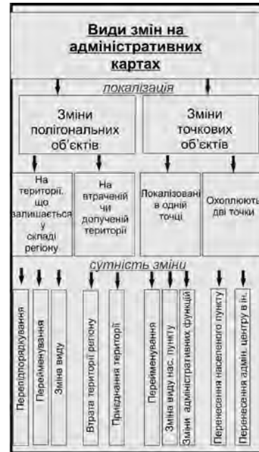
Рис. 2. Види змін на адміністративних картах

Види змін виділяли відповідно до мети режиму – унаочнення локалізації змін (рис. 2). Тому розрізняємо зміни, локалізовані на територіях, та зміни, локалізовані у точках. Зміни на територіях розділяємо на такі: зміни на території, що залишається у складі регіону, зміни на втраченій території, зміни на приєднаній території. Зміни у точках розділяємо на такі, що локалізовані в одній точці, й такі, що охоплюють дві точки. Тільки після виділення видів локалізації змін розділяємо їх за сутністю.