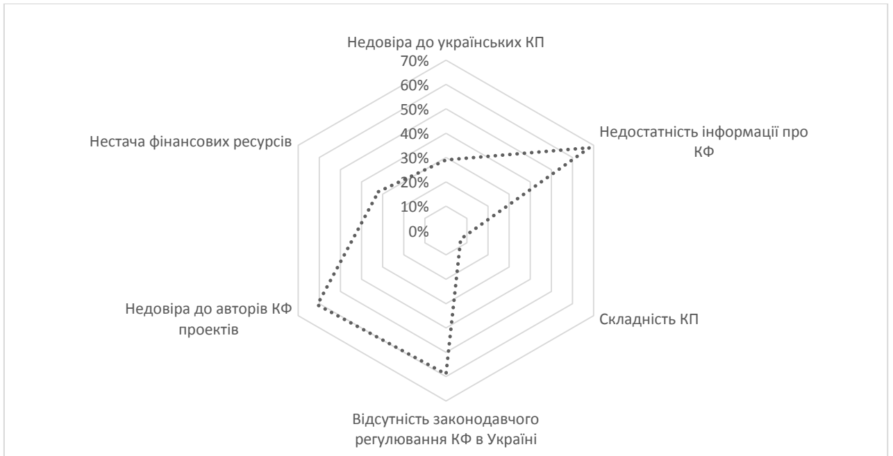
Рис. 3. Причини неучасті респондентів у краудфандингу (КФ) на краудфандингових платформах (КП)

Примітка: сформовано автором за результатами опитування