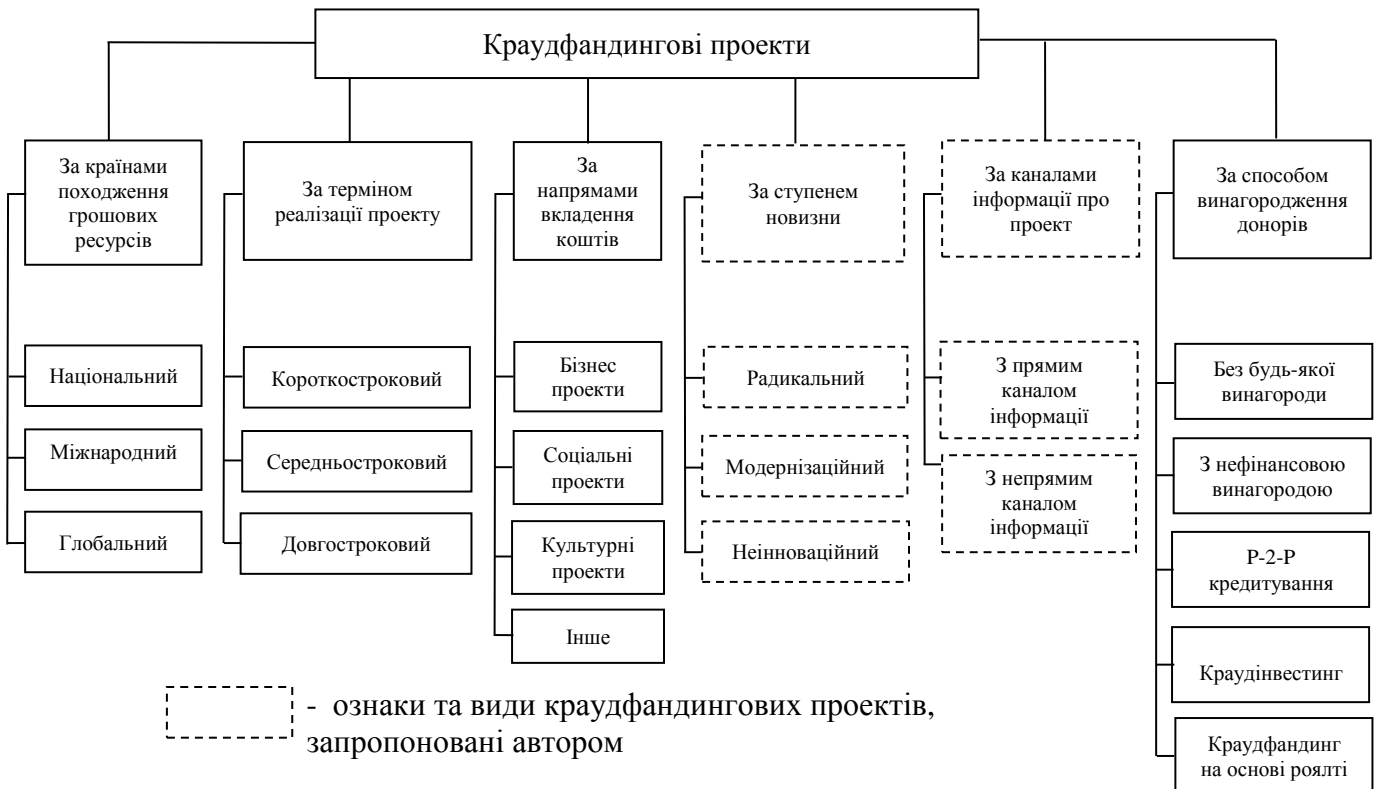
Рис. 1. Типологія краудфандингових проектів

Сутність, змістове наповнення та різноманітність краудфандингових проектів викликає необхідність ретельного дослідження краудфандингу з метою активного використання цього інструменту вітчизняними підприємствами. Одержані в результаті узагальнення наукових розробок вчених та практиків висновки дали змогу згрупувати та удосконалити типологію краудфандингових проектів за низкою важливих та незалежних ознак (рис. 1).