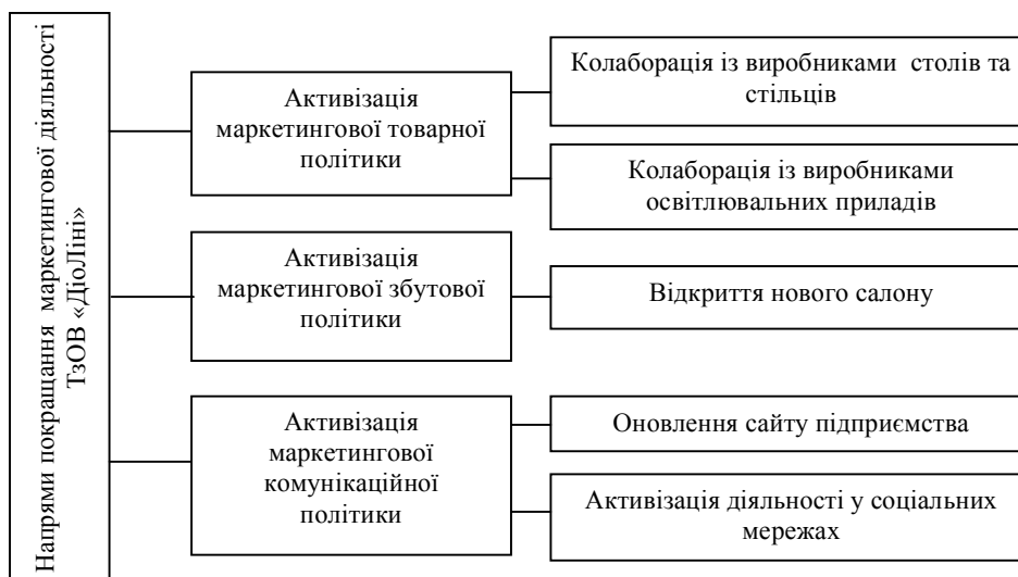
Рис. 2. Напрями покращання маркетингової діяльності ТЗОВ “ДіоЛіні”

Для обґрунтування пріоритетних напрямів покращання маркетингової діяльності ТЗОВ “ДіоЛіні” побудовано матрицю для попарної оцінки цих напрямів. Для розрахунку було використано 9-ти бальну шкалу, запропоновану Т. Сааті [9, с. 53] (1 бал – критерій рівноважливий; 3 бали – один критерій дещо переважає інший; 5 балів – один критерій переважає інший; 7 балів – один критерій суттєво переважає інший; 9 балів – один критерій абсолютно переважає інший; 2, 4, 6, 8 балів – компромісні рішення).