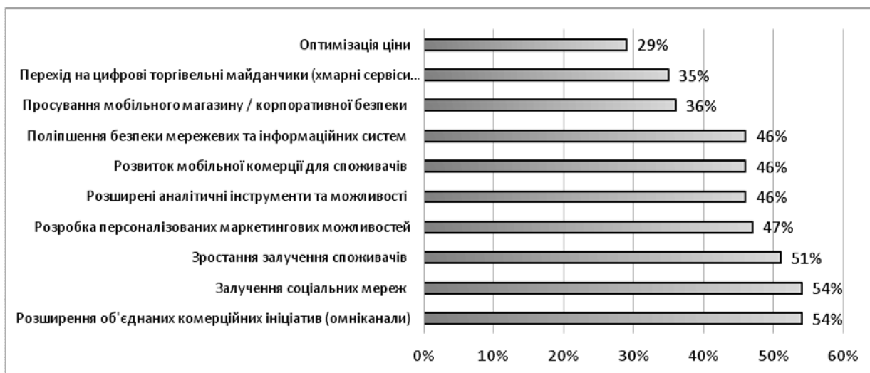
Рис. 2. Прогнозні стратегії цифрової трансформації протягом наступних 18 місяців

Згідно з [15], омніканальність (omnichannel) – підхід, принципами якого є цілісність та узгодженість споживчого досвіду. Значення “omni” можна перекласти як “існуючий всюди”. Це канал, який охоплює усі можливі комунікації зі споживачами. Клієнтам омніканальність дає змогу вільно переключатись між усіма можливими каналами комунікації з брендом: завдяки мобільним пристроям, соціальним мережам, а також офлайнним магазинам та терміналам обслуговування. За допомогою омніканальності компанії не втрачають інформацію про клієнта, а це дозволяє зберегти персоналізований підхід та зібрати достовірну базу покупців. Компанії, які використовують такий метод, стверджують, що споживачі цінують здатність перебування в постійному контакті з компанією через безліч шляхів одночасно, не перериваючи при цьому виконання своїх дій. Деякі оцінки переваг застосування омніканалів наведені на рис. 3.