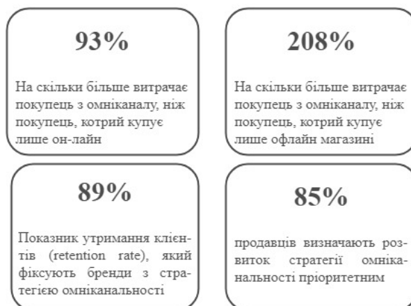
Рис. 3. Порівняльні переваги застосування омніканалів Джерело: [10, с. 13]