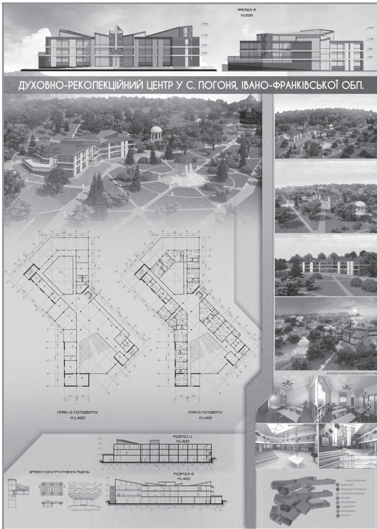
Рис. 3. Проектна пропозиція паломницького духовно-реколекційного центру у с. Погоня (арх. К. Т. Негрич (К. Т. Голубчак))