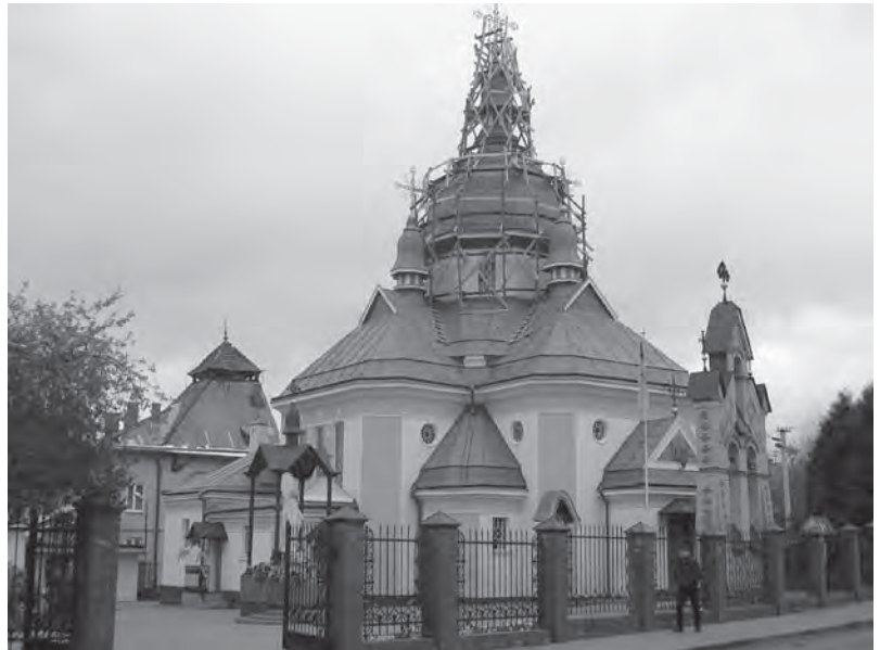
Рис. 8. Церква св. Андрія Первозванного на Клепарові. Арх. Сергій Тимошенко. 1923–1939 рр.