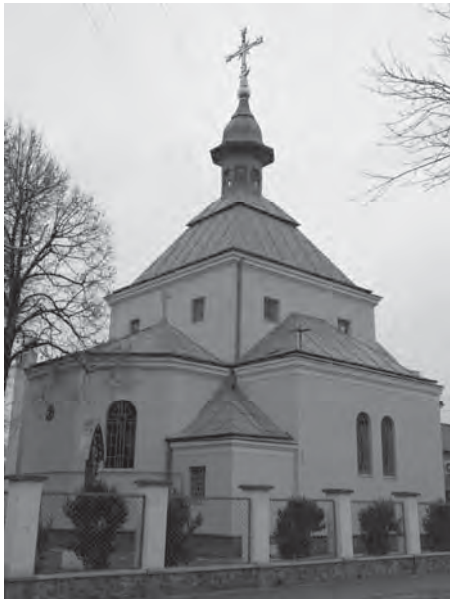
Рис. 7. Церква св. Андрія і Йосафата на Левандівці. Арх. Сергій Тимошенко. 1921–1923 рр.