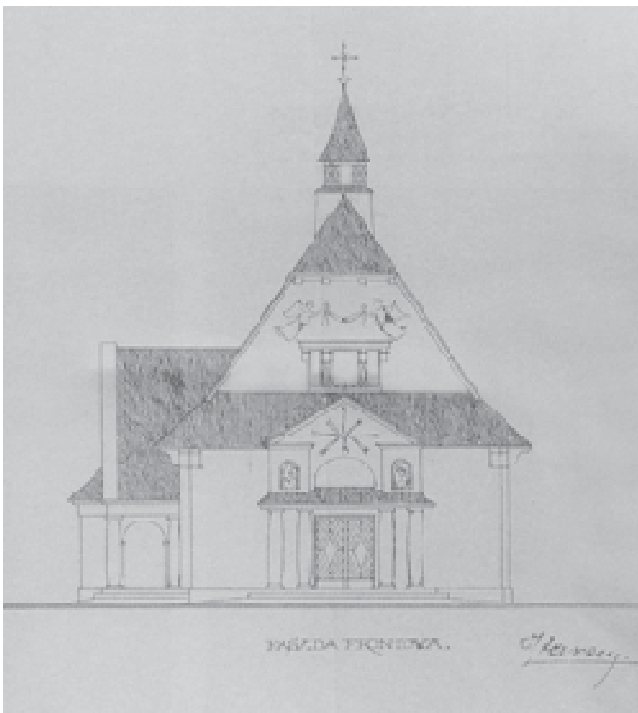
Рис. 1. Костел Матері Божої Неустанної Помочі на Левандівці. Арх. Генрик Заремба. 1921 р. [3]

наріжний камінь під храм. Того самого року, за проектом архітектора Зигмунта Крикевича, на кошти капуцинської провінції монахи побудували першу дерев'яну однонавну каплицю, яку освятили під титулом святого Франціска Асізкого [5]. Вже у 1909 р. вперше починають порушувати питання розширення монастирського комплексу та перебудови каплиці у мурованому вигляді. Повторно до цього питання повертаються лише на початку 1920 років. Для опрацювання проекту запрошено відомого тогочасного архітектора Яна Кароля Саса-Зубрицького – випускника та викладача Львівської політехніки [6]. Роботу над проектом завершено у 1921 р. Автор приділив особливу увагу стилю будівлі, що для нього, як патріота “національних стилів” закономірно. Найприйнятнішими для нього були ремінісценції польського (зигмунтовського) Ренесансу та надвісянської готики, що асоціювались з добою розквіту держави та її незалежністю. Після затвердження проекту, у 1925 році, і закладання фундаменту та освячення наріжного каменя, розпочинають зводити мурований костел. У 1927 році, за проектом того самого Я. Саса-Зубрицького, з південного боку костелу починають прибудовувати монастирські келії. Проте все ще не задоволені проектом капуцини попросили внести свої корективи і сюди, що і зробив керівник будівельних робіт Франциск Квецінський. 5 листопада 1930 року Львівський латинський архієпископ Болеслав Твардовський освятив новозбудований храм під тим самим титулом костелу святого Франціска Асізкого [7] (рис. 2).