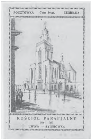
Рис. 5. Костел св. Петра та Павла на Сигнівці. Арх. Вавжинець Дайчак. 1931–1939 рр.