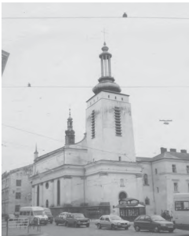
Рис. 3. Відбудова вежі костелу Кларисок. Арх. Антоній Лобос та Владислав Витвицький. 1939 р.

Актуальність пошуку сучасного образу католицьких храмів засвідчено в публікаціях молодшого покоління архітекторів. Їх головна ідея полягала в тому, що не лишень внутрішній сакральний зміст повинен єднати католицьку святиню з традицією, цю спорідненість потрібно продемонструвати також у зовнішніх архітектурних формах, оскільки "...не для того ми вивчали історію польської архітектури, аби не пам'ятати про неї при творенні нових будівель" [12]. Звідси впливала принципова теза: костели необхідно проектувати і будувати, не копіюючи безпосередньо конкретні історичні стилі, проте пам'ятаючи про їхнє значення для вшанування культурних надбань нації та континуації традицій.