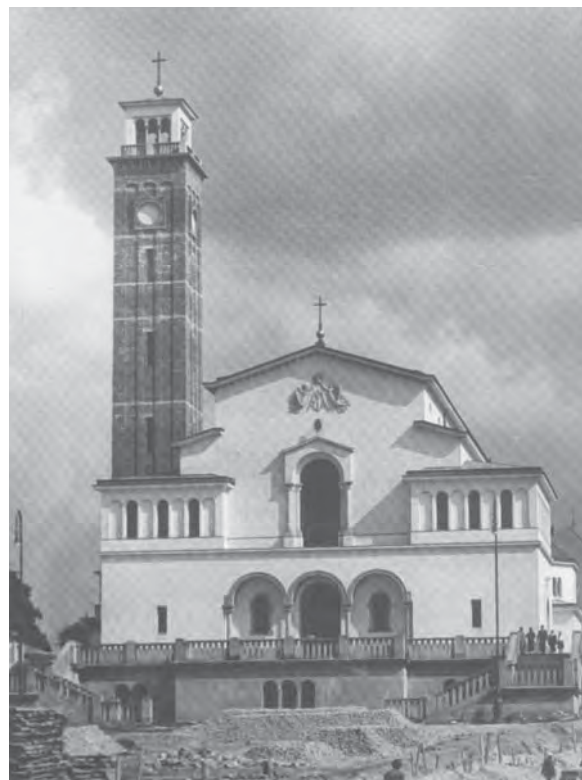
Рис. 4. Костел Матері Божої Остробрамської. Арх. Тадеуш Обмінський. 1930–1934 рр. [15]