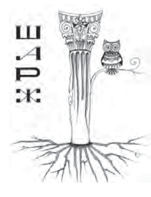
Рис. 6. “Нічний світильник”