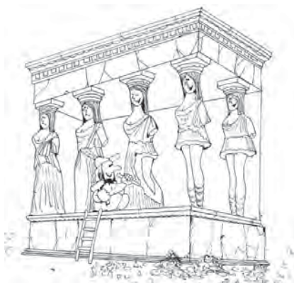
Рис. 1. “Кариатиди”