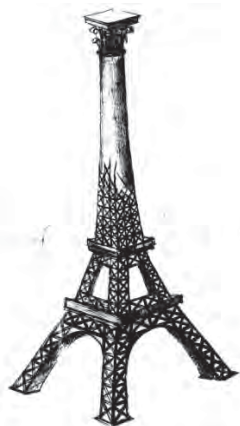
Рис. 7. “Творчий світильник”