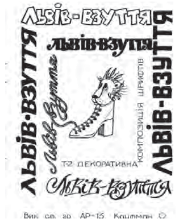
Рис. 9. “Запрошення на виставку”