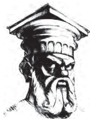
Рис. 3. Посвячення в “Зевси”