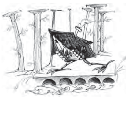
Рис. 5. “Хатинка в турпоході”