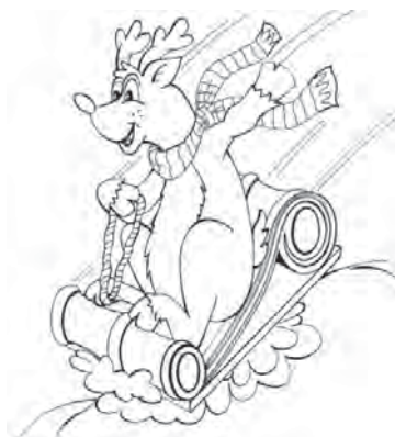
Рис. 4. “А ми на grindжолох”