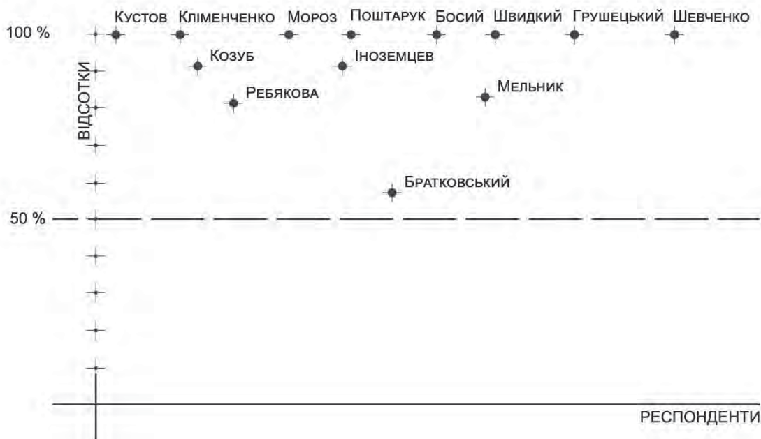
Рис. 2. Відсоток творчої діяльності у театральному середовищі опитаних респондентів

Анкетне опитування засвідчило, що у творчому доробку театральних діячів-практиків високий показник роботи у творчому театральному середовищі. У відсотковому співвідношенні 13 респондентів зазначили показники, вищі за 50 %. Для прикладу, Р. Братковський з Івано-Франківська – 55 %, М. Ребякова з Черкас – 80 %, О. Мельник з Черкас – 82 %, М. Козуб з Полтави – 90 %, О. Мельник з Полтави – 90 %, С. Кустов зі Львова – 100 %, П. Босий з Торонто – 100 %, У. Мороз зі Львова – 100 %, В. Шевченко з Полтави – 100 % та інші (рис. 2). Тобто можна стверджувати, що всі опитані театральні діячі – одні менше, другі більше все професійне життя займаються творчою діяльністю у театральному середовищі, а саме у будівлях лялькових театрів і театрів для юних глядачів.