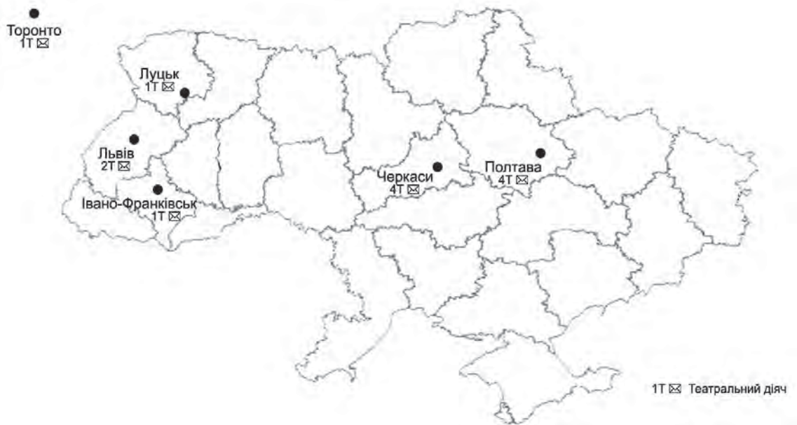
Рис. 1. Ареал опитування респондентів – театральних діячів