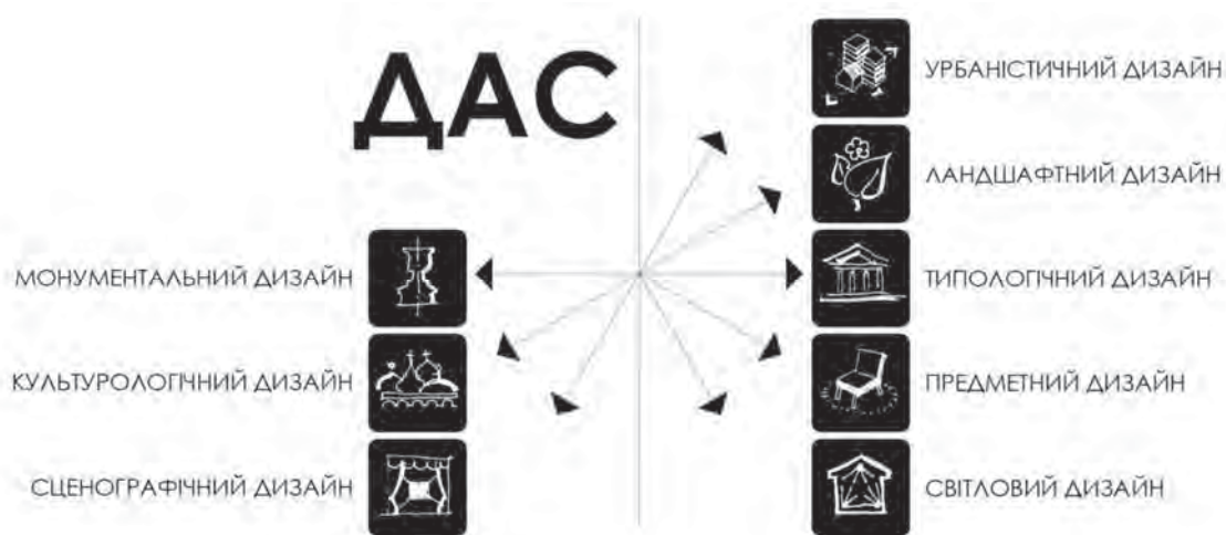
Рис. 1. Актуальні напрями навчання на кафедрі дизайну архітектурного середовища Львівської політехніки

Якщо розглянути освітню діяльність українських архітектурних шкіл (з яких 16 розташовані в 12 містах країни), то можна зробити висновок: незважаючи на затверджені Міністерством освіти спеціальності, програми, навчальні плани, всі архітектурні школи широко культивують лише один базовий тип освіти. Наприклад, на АРФ Національної академії образотворчого мистецтва популярні етапи творчо-магістерські, якими керують відомі педагоги. А на АРФ Київського національного університету будівництва й архітектури і в Інституті архітектури «Львівської політехніки» в ХХІ ст. домінує університетський тип, хоча паралельно створюються і діють групи (з п'яти–шести студентів), які очолюють провідні педагоги-вчителі з великим прикладним досвідом. Фактично вся активна освітньо-проектна діяльність в усіх архітектурних школах України подібна до форм освіти у згаданих закордонних вищих навчальних закладах, але розпочинається після першого–другого курсу, через певні причини. Наприклад, на кафедрі дизайну архітектурного середовища за останні 15 років сформувалася широка палітра освітніх напрямів: архітектурно-типологічний дизайн, ландшафтний, урбаністичний, предметний, світловий дизайн, а також дизайн монументальний, культурологічний, сценографічний (рис. 1).