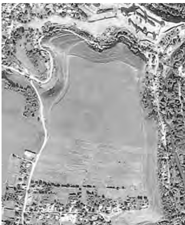
Рис. 1. Супутниковий знімок урочища Татариски