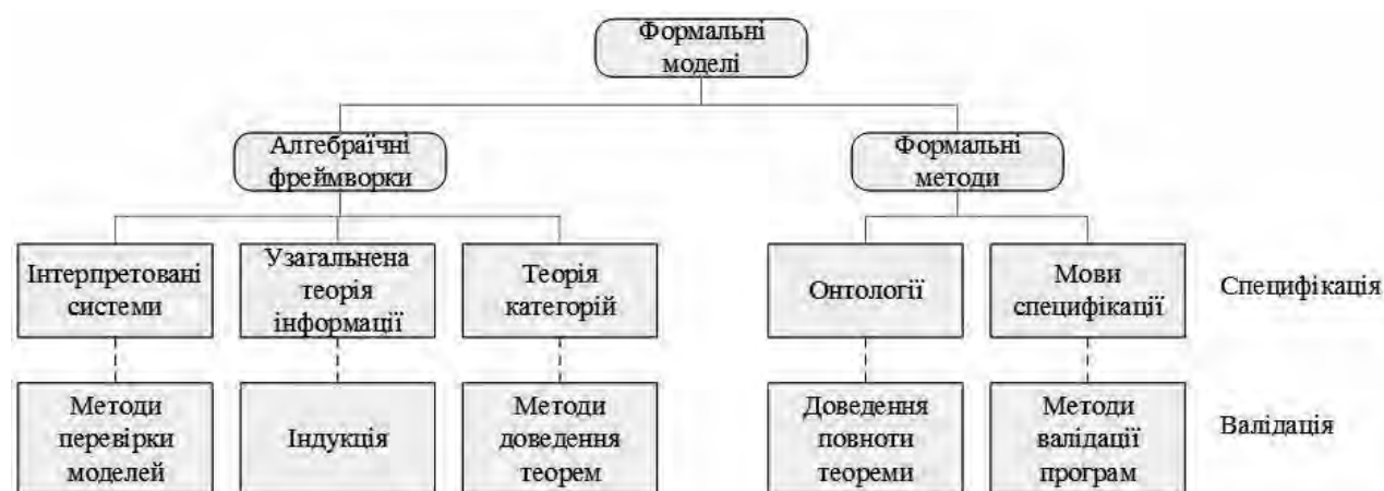
Рис. 1. Класифікація формальних моделей СО

Запропоновану класифікацію формальних моделей [3] наведено на рис. 1.