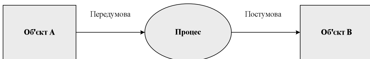
Рис. 3. Відображення перетворення об'єкта у вигляді графу

де P є властивістю домена; B – булеве значення і C – вміст домена. Encd , enum , eval – операції кодування, підрахунку та оцінки. Елементи області композиції відображають процес перетворення об'єкта під час моделювання (рис.3) у вигляді дводольного графу.