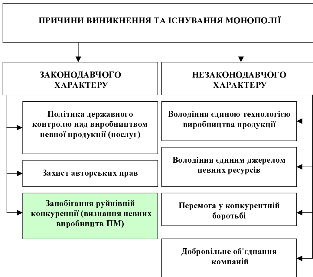
Рис. 3. Класифікація причин виникнення та існування монополій

Висновки. Підбиваючи підсумок виконаному у цій статті дослідженню, зазначимо: