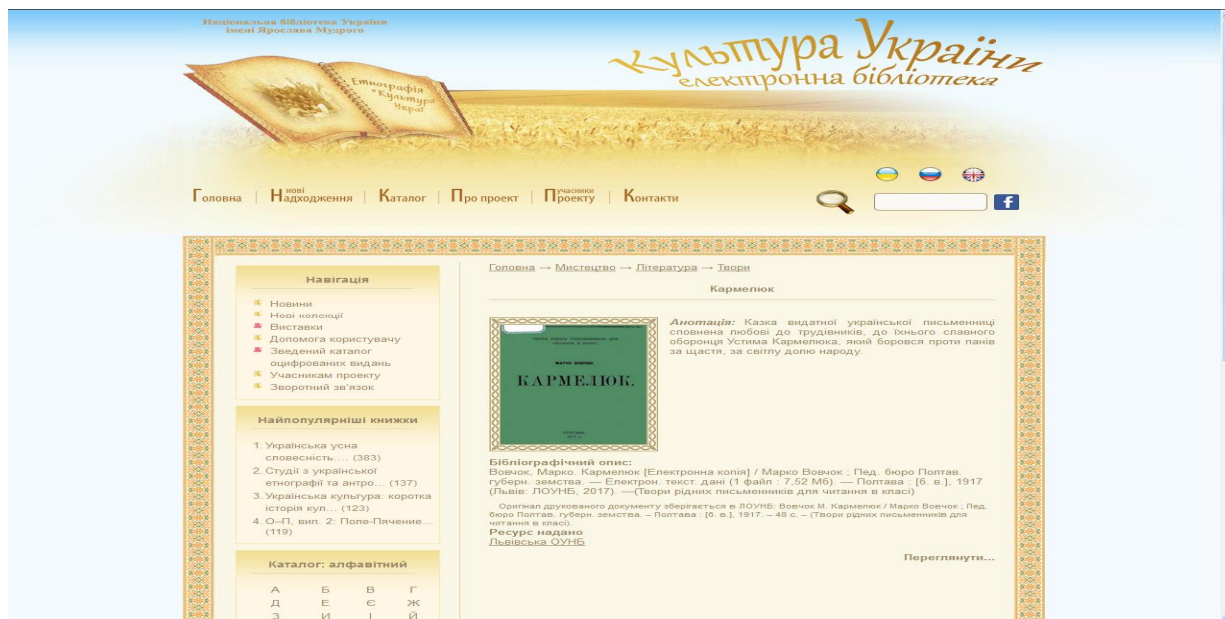
Рис. 7. Електронна бібліотека «Культура України»

Оскільки їх електронні копії зберігаються в НБУ ім. Ярослава Мудрого, то з ними можна ознайомитись на сайті бібліотеки у базі даних «Електронна бібліотека «Культура України» (8 132 док.) (Рис. 7).