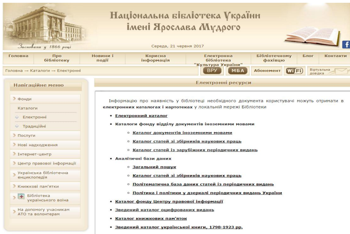
Рис. 1. Електронні ресурси НБУ ім. Ярослава Мудрого

З усіма електронними каталогами НБУ ім. Ярослава Мудрого можна ознайомитись на сайті ( http://www.nplu.org/ ) (Рис. 1).