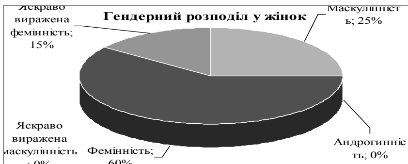
Рис. 2. Показники розподілу гендерних особливостей у жінок експериментальної групи

йових дій за Методикою «Дослідження гендерних ролей» (за С. Бем). Так було встановлено, що у чоловічої статі переважає маскулінність (60%), на другому місці – яскраво виражена маскулінність (25%) і на третьому – фемінність (15%), при цьому андрогинність та яскраво виражена фемінність не були представлені (рис. 1). У жінок, учасниць АТО, на першому місці стоїть фемінність (60%), на другому маскулінність (25%) і на третьому місці представлена яскраво виражена фемінність (15%) (рис. 2).