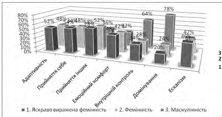
Рис.10. Показники прояву соціально-психологічної адаптації жінок експериментальної групи за гендерним розподілом

Висновки. Отже, отримані дані підтверджують нашу гіпотезу про те, що гендерні особливості чоловіків та жінок впливають певним чином на їх соціально-психологічну адаптацію до умов мирного життя, яка має також свої особливості прояву.