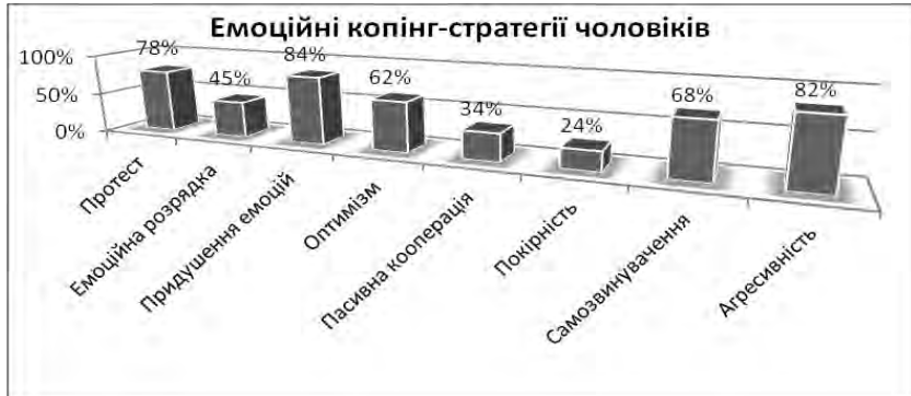
Рис. 5. Показники розподілу емоційних стратегій копінг-механізмів у чоловіків експериментальної групи

Жінки з яраво вираженою фемінністю в своїй соціально-психологічній адаптації найчастіше використовують наступні копінг-стратегії: збереження самовладання, релігійність, додачу значення, покірність, пасивну кооперацію, оптимізм, альтруїзм, відвернення, співпрацю (рис. 4, 6, 8).