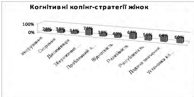
Рис. 4. Показники розподілу когнітивних стратегій копіюючих-механізмів у жінок експериментальної групи

Чоловіки з маскулітністю в своїй соціально-психологічній адаптації найчастіше використовують наступні копіюючі-стратегії: проблемний аналіз, релігійність, установку власної цінності, емоційну розрядку, оптимізм, пасивну кооперацію, конструктивну активність, звертання, співпрацю.