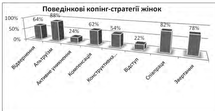
Рис. 8. Показники розподілу поведінкових стратегій копінг-механізмів у жінок експериментальної групи

Жінки з маскулінністю в своїй соціально-психологічній адаптації найчастіше використовують наступні копінг-стратегії: скорення, дисиміляцію, придушення емоцій, агресивність, протест, відступ, активне уникнення, компенсацію.