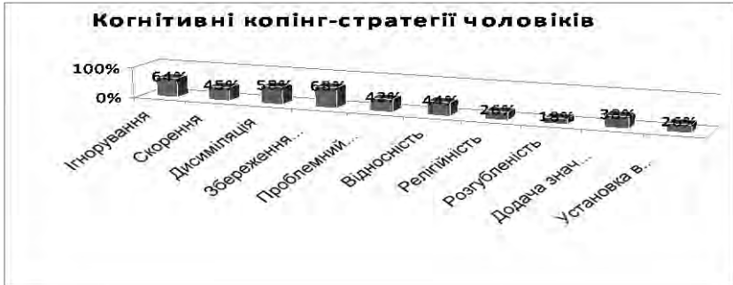
Рис. 3. Показники розподілу когнітивних стратегій копіюючих-механізмів у чоловіків експериментальної групи

Чоловіки з маскулітністю в своїй соціально-психологічній адаптації найчастіше використовують наступні копіюючі-стратегії: проблемний аналіз, релігійність, установку власної цінності, емоційну розрядку, оптимізм, пасивну кооперацію, конструктивну активність, звертання, співпрацю.