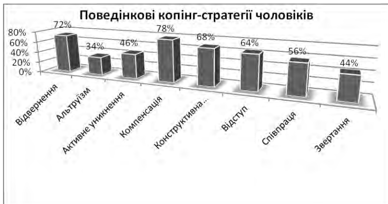
Рис. 7. Показники розподілу поведінкових стратегій копінг-механізмів у чоловіків експериментальної групи

Жінки з маскулінністю в своїй соціально-психологічній адаптації найчастіше використовують наступні копінг-стратегії: скорення, дисиміляцію, придушення емоцій, агресивність, протест, відступ, активне уникнення, компенсацію.