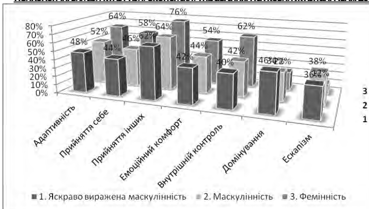
Рис. 9. Показники прояву соціально-психологічної адаптації чоловіків експериментальної групи за гендерним розподілом

За методикою “Діагностика соціально-психологічної адаптації” (за К. Роджерсом – Р. Даймондом) отримані дані говорять про те, що більшість фемінних чоловіків мають більш стабільну адаптацію у порівнянні з яскраво вираженими маскулінними, або ж маскулінними чоловіками, про яку свідчать: адаптивність, прийняття себе, прийняття інших, емоційний комфорт, внутрішній контроль, прагнення до відсутності домінування та нонконформізму, значно менші показники прагнення до втечі (ескапізму) (рси. 9).