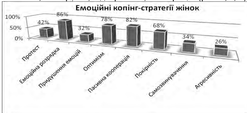
Рис. 6. Показники розподілу емоційних стратегій копінг-механізмів у жінок експериментальної групи

Жінки з яраво вираженою фемінністю в своїй соціально-психологічній адаптації найчастіше використовують наступні копінг-стратегії: збереження самовладання, релігійність, додачу значення, покірність, пасивну кооперацію, оптимізм, альтруїзм, відвернення, співпрацю (рис. 4, 6, 8).