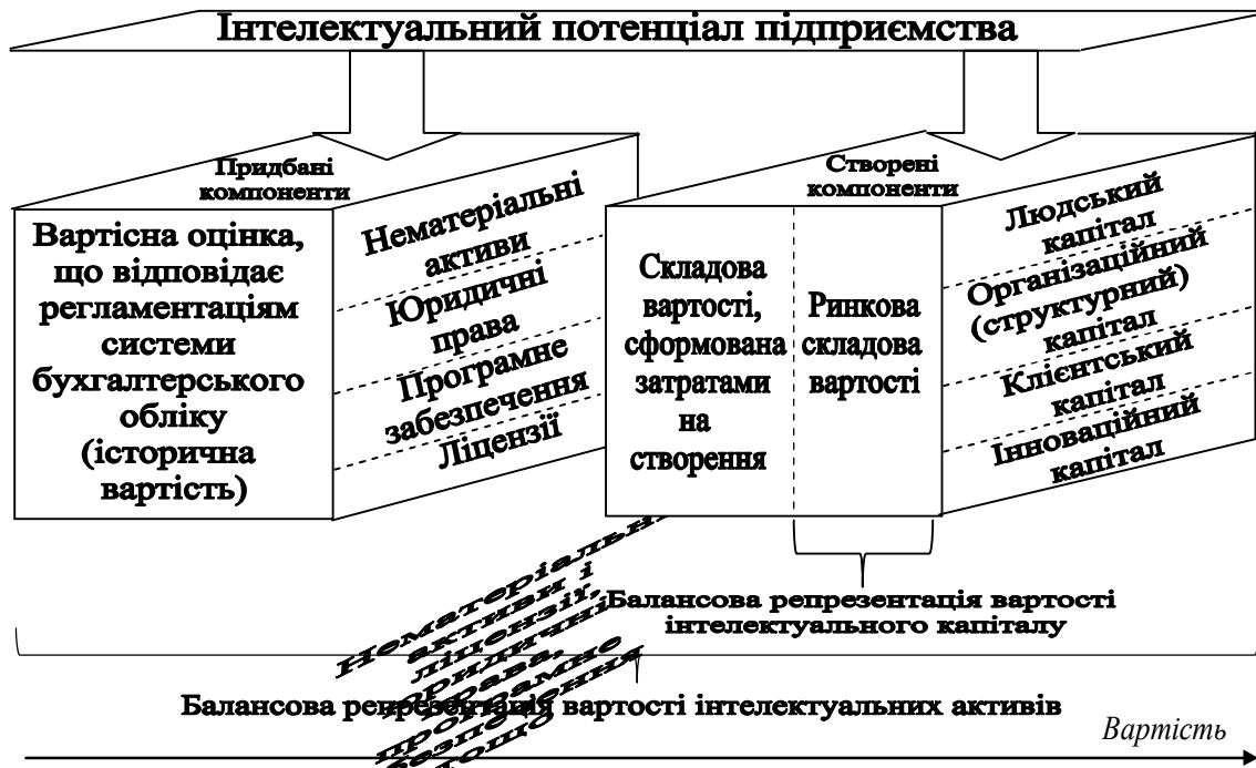
Рис. 2. Балансова репрезентація інтелектуального потенціалу компанії

Найпроблемнішим аспектом методології бухгалтерського обліку інтелектуального капіталу є визнання й оцінювання окремих видів інтелектуальних активів. Критерії визнання інтелектуальних активів повинні давати змогу не лише відокремити такі активи за їх видами й функціональним призначенням, але й відрізнити токсичні активи від продуктивних. Очевидно, навряд чи можливо встановити уніфіковані критерії визнання продуктивних інтелектуальних активів. Головною умовою визнання має бути спроможність активів генерувати економічні вигоди в майбутніх звітних періодах, початок яких повинен бути чітко визначеним, а не гіпотетичним. Чіткість часового критерію має бути строго дотримана, а у разі його порушення факт визнання активу повинен бути переглянутий.