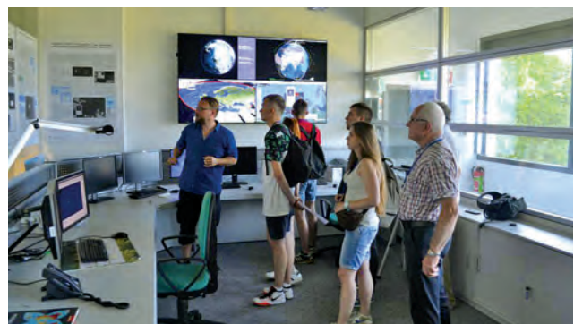
Студенти ІГДГ в німецькому Центрі повітроплавання та космічних досліджень