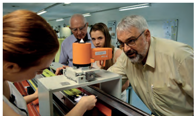
В метрологічній лабораторії університету