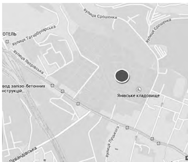
Рис. 1. Схема розташування Нового єврейського кладовища у Львові

Територія кладовища обмежена частиною (155 м) проїжджою вул. Єрошенка від вул. Шевченка та 195 м територією ПАТ “Львівгаз” зі сходу, схилом та гаражним кооперативом з півночі, кварталом промислових будівель ПП “Знак якості” 150 м від вул. Єрошенка, ще на 95 м промисловими будівлями “Азов-Галичина” з півдня та християнським цвинтарем із заходу (рис. 1).