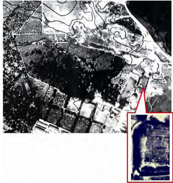
Рис. 6. Архівний аерознімок 1934 р. з вказаним місцем поховань єврейських воїнів, що загинули у 1914–1918 рр. (15 рядів могил, в кожному з яких не менше від 23 поховань)

За отриманими даними створено два графічні документи масштабу 1:1000 на форматі A2. На них відтворено початкову межу кладовища в межах сучасної містобудівної ситуації та всі її зміни з часом (рис. 7, 8).