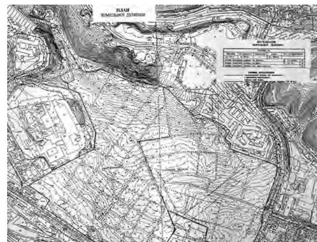
Рис. 5. Сучасний топографічний план території Янівського кладовища у Львові