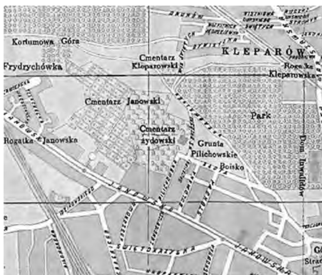
Рис. 2. Фрагмент польської карти Львова 1938 р.

Вхідними матеріалами для досліджень слугували: