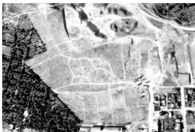
Рис. 4. Архівний німецький аерознімок 1944 р.