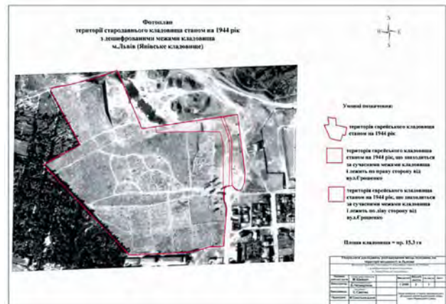
Рис. 7. Фотоплан території єврейського кладовища у 1944 р. з дешифрованими межами кладовища