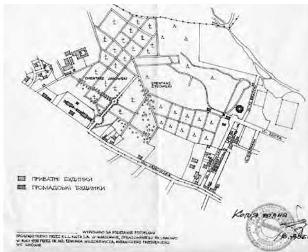
Рис. 3. Польський план території кладовища 1936 р.