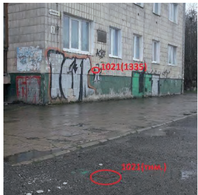
Рис. 2. Візуалізація розташування пункту 1021