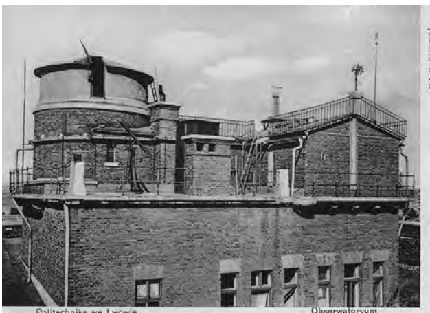
Рис. 2. Зовнішній вигляд астрономічної обсерваторії Львівської політехніки