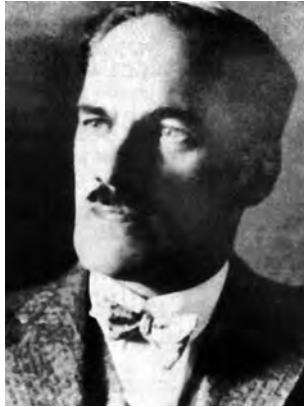
Рис. 5. Каспар Вайгель

К. Вайгель закінчив інженерний факультет ВПШ у Львові, де геодезичні дисципліни йому викладали професор С. Відт, а астрономію та фотограмметрію – професор В. Ласка. Найбільший інтерес у нього викликали врівноваження геодезичних вимірів та нова на той час наука – фотограмметрія. Відразу після захисту дипломної роботи з липня 1903 р. К. Вайгель почав працювати на трасуванні та будівництві локальної залізниці Львів–Підгайці. Ця ділянка залізниці функціонувала з 1909 р. і була знищена під час війни у 1944 р.