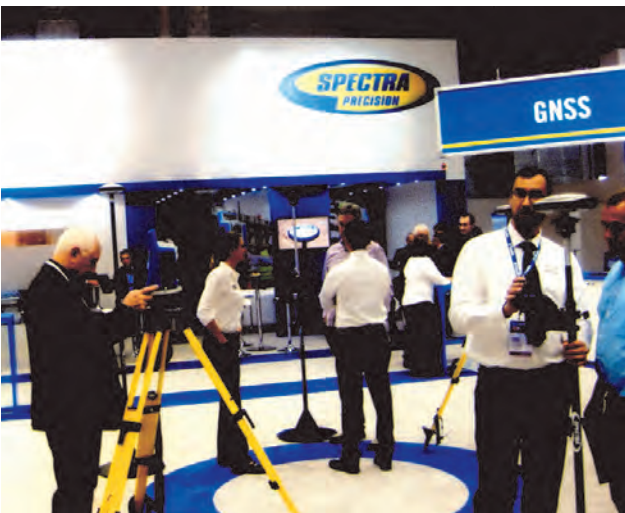
У павільйоні фірми "Spectra Precision"