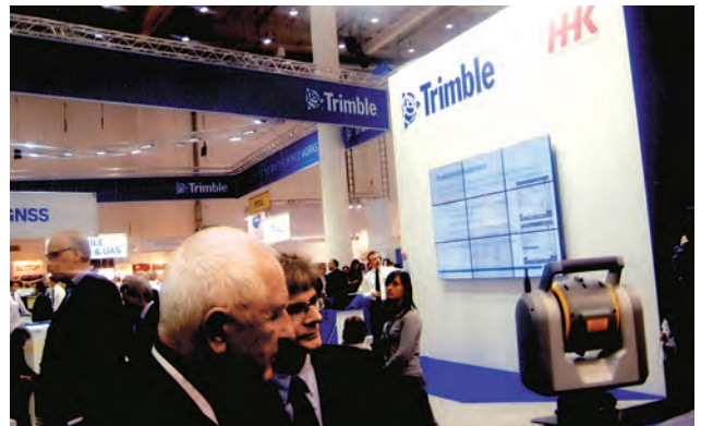
Супероригінальний сканувальний електронний тахеометр Trimble SX10