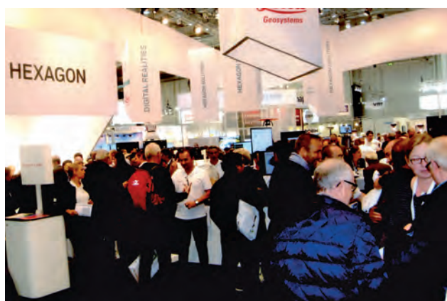
Стенд фірми Leica Geosystems (концерн HEXAGON)