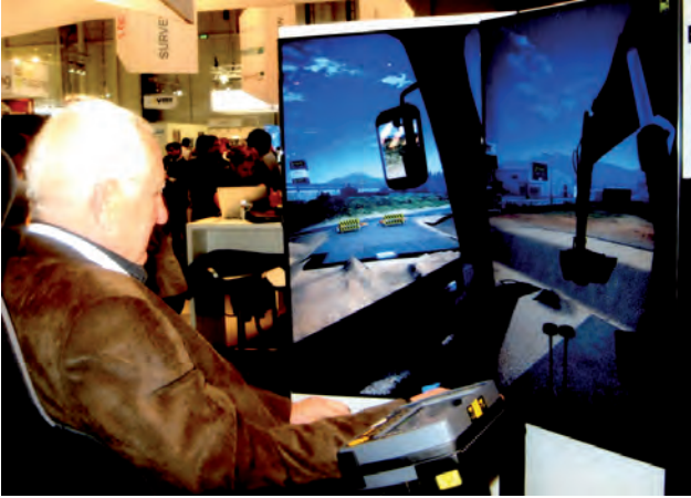
Ознайомлення із системою управління землерийною технікою фірми "Leica Geosystems"