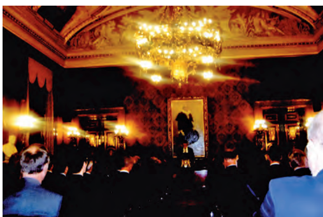
На урочистому засіданні (Kongresseröffnung) напередодні відкриття "INTERGEO-2016"