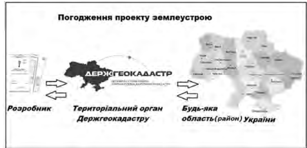
Рис. 1. Схема погодження проекту землеустрою

Вирішенням проблеми таких частих відмов у погодженні проекту землеустрою може бути створення еталонного проекту землеустрою щодо відведення земельної ділянки, у якому би зазначалися усі вимоги для створення повноцінного проекту. Це, звісно, дуже складно зробити, тому що під час розроблення такого еталонного проекту потрібно врахувати всі нюанси. Для цього необхідно об'єднати інформацію з чинних законів, постанов, інструкцій.