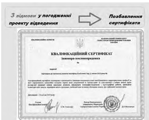
Рис. 4. Наслідки відмов у погодженні проекту відведення