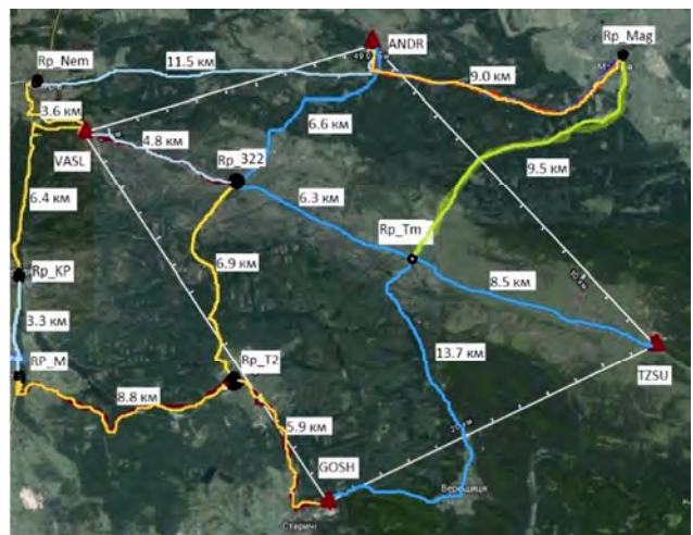
Рис. 2. Схема мережі геометричного нівелювання II класу

Для контролю похибки результатів GPS-нівелювання, які можна отримати за різними методиками, необхідно пункти еталонного лінійного базису і фундаментальної геодезичної мережі перетворити на реперні точки. Для цього висота кожного пункту повинна бути отримана з геометричного нівелювання II класу [17]. У 2014–2016 рр. розвинено мережу геометричного нівелювання II класу (рис. 2). Загальна довжина подвійних ходів нівелювання з прив'язкою до реперів I класу становить 120 км. Нівелювання здійснено кодовим нівеліром Leica DNA-03. Нев'язки у полігонах нівелювання від 2,1 до 3,3 мм.