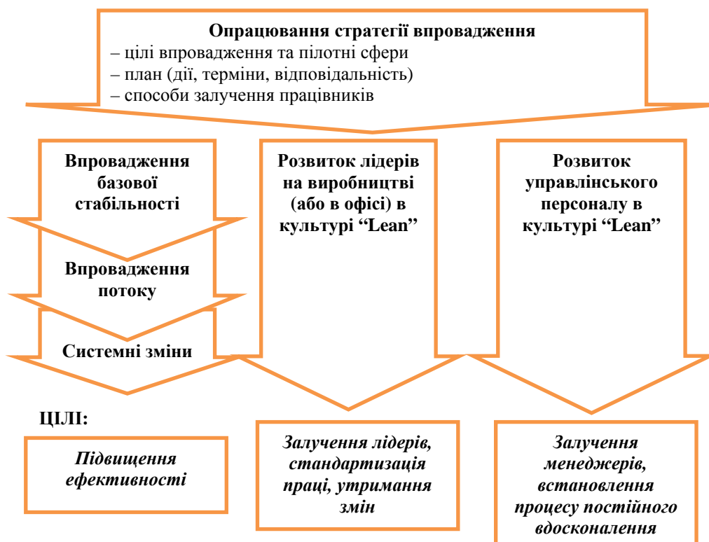
Рис. 3. Процес та цілі впровадження концепції “Lean” у процес виробництва та управління

Упровадження у діяльність виробничого підприємства концепції Lean-менеджменту схематично зображено на рис. 3.