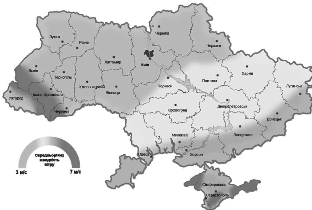
Рис. 1. Мапа вітрів України

Україна має значний природний потенціал для відновлювальної електрогенерації, зокрема вітрової. На рис. 1 наведено мапу вітрів України, яка дасть змогу визначити найпридатніші регіони для зведення вітрогенерувальних потужностей. Як бачимо, високий вітроенергетичний потенціал в Українських Карпатах, Кримських горах, узбережжя Чорного, Азовського морів та Донецької височини. Сильні середньорічні вітри також на височинах південно-західної України та Придніпровської височини. Найпридатнішими місцями для встановлення вітрогенераторів є ділянки біля водойм (ставків, озер, річок) або височини, які здіймаються над основним рельєфом. Такі ділянки є на всій території України, але потрібно враховувати, що вітер – нестабільна величина, відрізняється впродовж року та залежить від погодних умов і пори року [16]. На мапі вказано силу вітру на висоті 10 м. Якщо говорити про промислові масштаби створення таких об’єктів, то вітрові установки набагато вищі. Відповідно, зростає сила вітру.