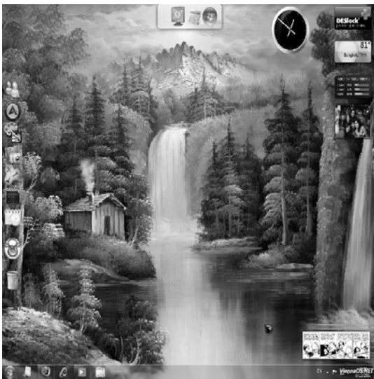
Рис. 1. Початкове зображення

При P = 83, Q = 53 результати наведено на рис. 1–3.