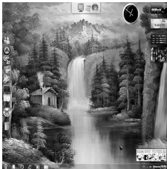
Рис. 3. Дешифроване зображення

При P = 101, Q = 103 для іншого зображення результати наведені на рис. 4 – 6.