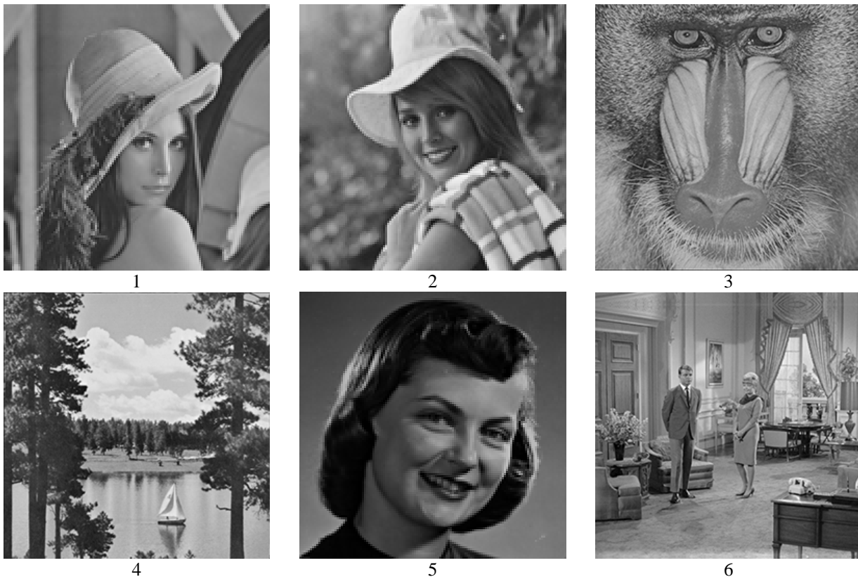
Рис. 2. Зразки зображень тестової вибірки (168×168 пікселів)

Для дослідження обрано найвживаніші та перспективні методи забезпечення надвисокої роздільної здатності у випадку одного вхідного зображення: методи Янга, Зейде; методи на основі використання градієнтних профілів, нейроподібної структури моделі геометричних перетворень та конволюційної нейронної мережі; класичний метод – бікубічна інтерполяція. Параметри роботи методу Янга наведено у [15], Зейде – у [16], градієнтних профілів – у [6]. Навчальну вибірку методу на основі конволюційної нейронної мережі, за якою синтезували зображення високої роздільної здатності, наведено у [24]. Навчання методу забезпечення надвисокої роздільної здатності зображень на основі НПС МГП відбувалося на парі зображень з рис. 3 (зображення низької роздільної здатності – № 1, зображення високої роздільної здатності у роботі не наведено). Параметри роботи НПС МГП наведено у [25, 26].