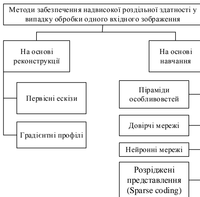
Рис. 1. Класифікація методів забезпечення надвисокої роздільної здатності у випадку обробки одного вхідного зображення

Інша група методів [5–7] під час розв’язання задачі забезпечення надвисокої РЗ використовує gradientні профілі. Їх застосування пояснюється високою стійкістю при масштабуванні зображень [7]. Окрім цього, працюючи в області gradientа, можна уникнути ряду артефактів на результуючому зображенні, зокрема ефекту “дзвону”. Ці методи, як і методи попередньої групи, знаходять відповідності між статистиками форми (в цьому випадку – gradientні профілі різкості) зображень низької та високої РЗ на основі навчання. Отриману інформацію використовують для накладання обмежень на основі gradientа у процесі реконструкції.