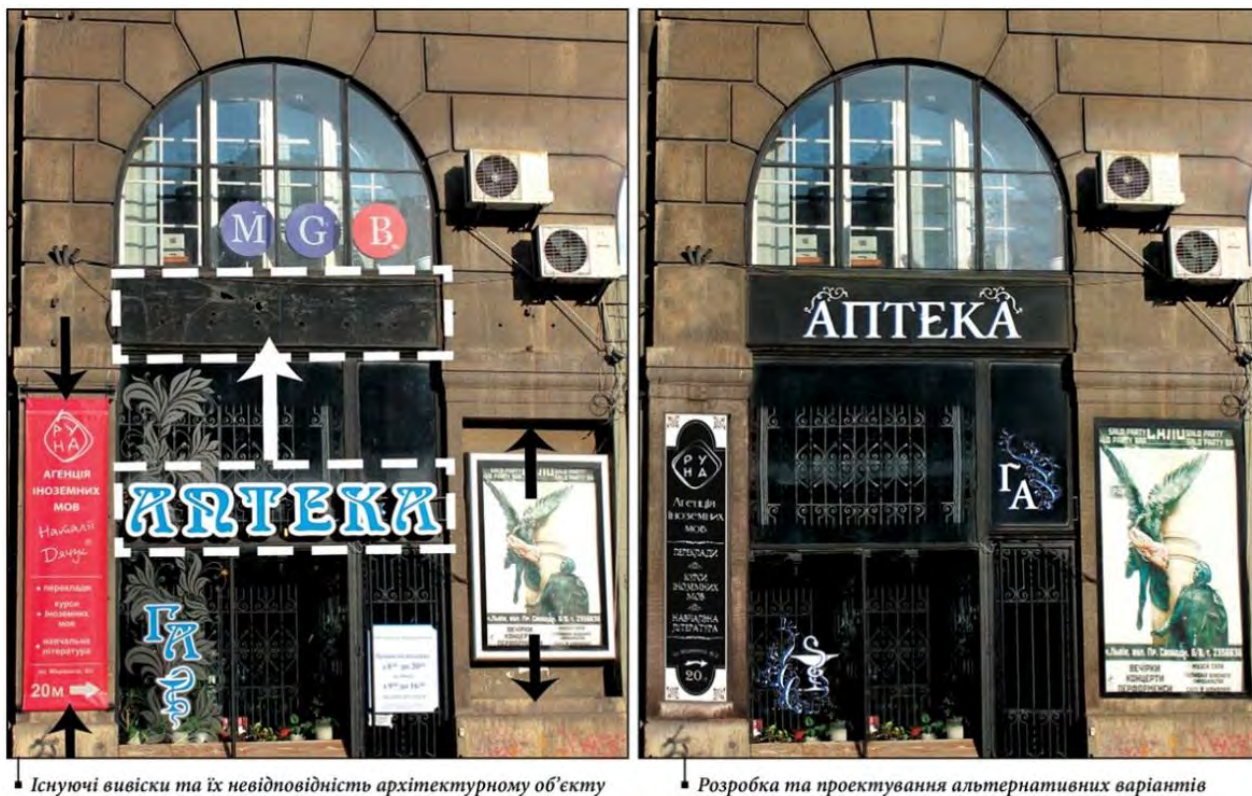
Рис. 4. Існуючі вивіски (зліва) та запропоновані варіанти (справа)