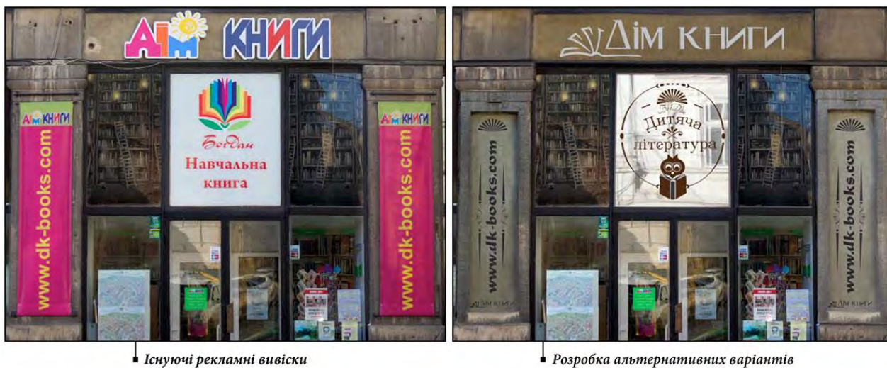
Рис. 3. Проектування реклами для книжкового магазину. Існуючі вивіски (зліва) та запропоновані варіанти (справа)