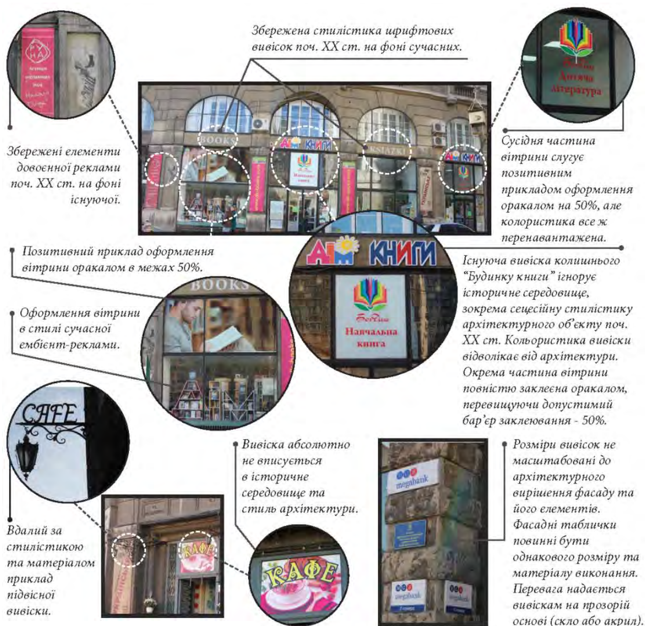
Рис. 2. Аналіз стану сучасних рекламних вивісок на архітектурному об'єкті

Створено і запропоновано альтернативні варіанти існуючих рекламних вивісок з візуалізацією на архітектурному об'єкті, що знаходиться у межах історико-архітектурного заповідника Львова – об'єкта світової спадщини ЮНЕСКО. Як приклад, об'єктом дослідження була обрана кам'яниця Шпрехера, яка є пам'яткою архітектури початку ХХ ст. з охоронним номером 190 згідно з рішенням облвиконкому № 130 від 26.02.80 р. (рис. 2). Будинок Шпрехера споруджений у стилі неокласицизму з елементами модернізму у 1912–1921 рр. за проектом архітектора Фердинанда Касслера на замовлення Йони Шпрехера, також відомий, як будинок № 8 і будинок Книги. Розміщений на центральній площі міста, названий на честь польського поета Адама Міцкевича.