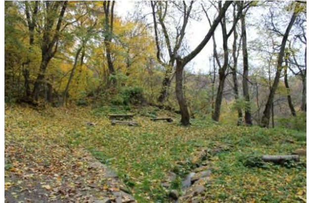
Рис. 4. Сучасний стан монастирського подвір'я ансамблю Преображення Господнього під Бучачем Тернопільської області (фото 2014 р.)