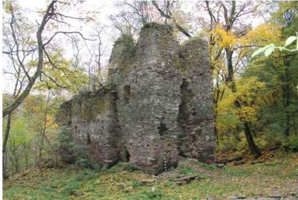
Рис. 3. Сучасний стан церкви монастирського ансамблю Преображення Господнього під Бучачем Тернопільської області (фото 2014 р.)

пам'ятки – це зони, що регламентують містобудівну діяльність у довкіллі пам'ятки з метою збереження історичного середовища пам'ятки, виявлення її композиційно-художньої цінності та доцільного використання. Наявність зон охорони пам'яток спрямовує реконструкцію населених місць, сприяє збереженню традиційного характеру середовища пам'яток і їх органічного включення у сучасне архітектурне середовище, максимальне використання композиційних і пейзажно-видових якостей пам'яток. З цього випливає перший принцип ревалоризації – принцип збереження цілісності меж .