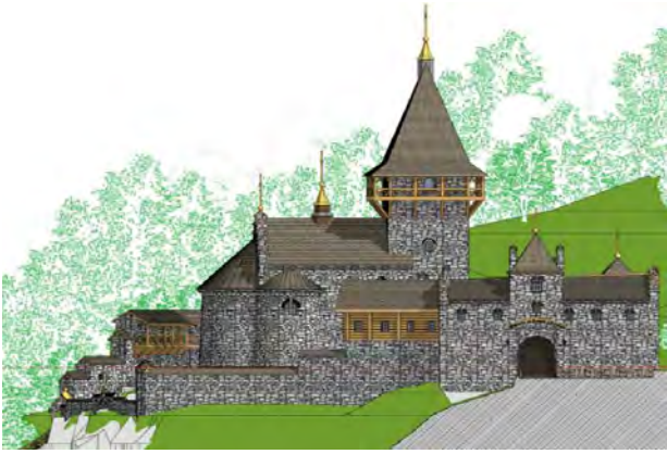
Рис. 6. Проектна пропозиція. Надбрамний корпус та церква монастирського ансамблю Преображення Господнього під Бучачем