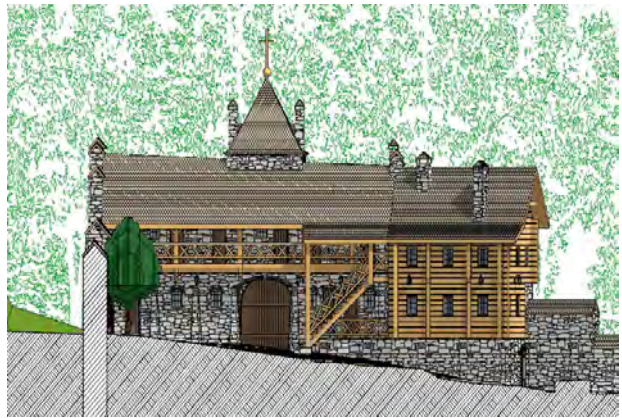
Рис. 8. Фасад монастирського ансамблю Преображення Господнього під Бучачем Тернопільської області. із музеєм та невеличким готелем для паломників

У процесі створення нової функції архітектурних ансамблів провідне місце посідає інтерпретація. Інтерпретація (від лат interpretatio – тлумачення, роз'яснення) – це тлумачення, трактування, розкриття змісту архітектурного вирішення проекту. Сприймаючи той чи інший архітектурний об'єкт, різні люди по-різному розуміють його залежно від індивідуальності, рівня розвитку, соціальної і національної належності. Твори мистецтва та архітектури, створені в минулому, завжди піддаються тій чи іншій інтерпретації у кожному нову епоху і є засобом їх "засвоєння" новими громадськими системами, людьми іншого світогляду тощо.