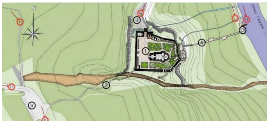
Рис. 9. Проектна пропозиція монастирського ансамблю Преображення Господнього під Бучачем Тернопільської області. (схема туристичних маршрутів)

Першочерговою проблемою під час розробки проекту було вибрати функцію для проєктованого об'єкта. Існувало кілька варіантів. Один з них – відновити монастирський комплекс з пристосуванням під духовно-освітній центр. Через те, що Бучацький колегіум імені святого Йосафата уже передбачає освітню функцію, від цього варіанта було вирішено відмовитися. Розвиток туризму та зацікавленість цими руїнами монастиря туристів та паломників, а також відсутність в Бучацькому районі духовного центру, проєктом передбачена ревалоризація оборонного монастирського комплексу з пристосуванням під паломницький центр. Ці пошуки вирішення є методом інтерпретації – базовим у процесі вироблення принципів ревалоризації архітектурних ансамблів монастирів ЧСВВ.