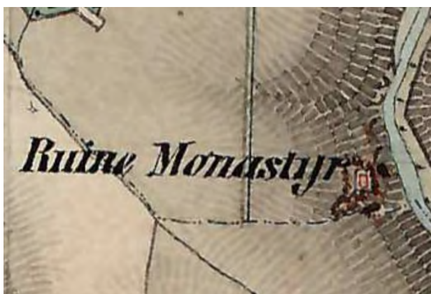
Рис. 1. Фрагмент карти австрійських обмірів (1806–1869 рр.) із зображенням руїн монастиря

Спробуємо опрацювати основні принципи ревалоризації на прикладі проектного рішення реконструкції оборонного монастирського комплексу Преображення Господнього під Бучачем Тернопільської області з пристосуванням його під паломницький центр.