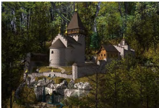
Рис. 5. Загальний вигляд монастирського ансамблю Преображення Господнього під Бучачем із навколишнім ландшафтом

Важливим елементом монастирського ансамблю є ландшафт, рельєф місцевості, а також різноманітні водойми, водоспади та інші природні або штучні елементи. Вони слугують збереженню містобудівної ролі монастирських ансамблів, а також забезпечують автентичні зони формування видів та візуальне розкриття пам'ятки. З цього випливає такий принцип ревалоризації – принцип збереження історично сформованого ландшафту .