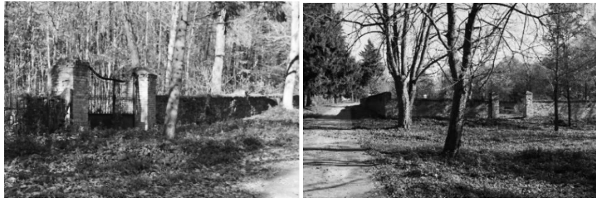
Рис. 3. Алеї парку

III етап: включає функціональну реконструкцію історичних палацово-паркових комплексів з урахуванням сучасних вимог до функціонального зонування усього комплексу під громадську функцію.