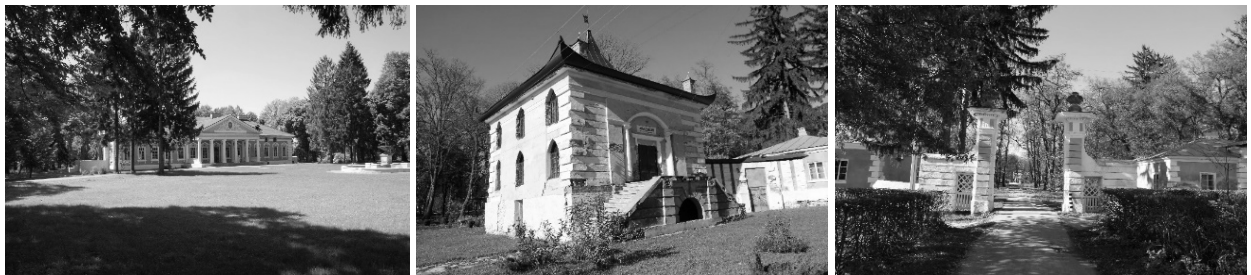
Рис. 2. Будівлі палацово-паркового комплексу: 1 – палац кінця XVIII ст.; 2 – китайський будиночок”, або “китайський павільйон”; 3 – в’їзна брама з прибрамними корпусами (фото автора, 2014 р.)

Довкола палацу у стилі класицизму знаходяться брама, прибрамні корпуси та “китайський будиночок”, який отримав від характерного для китайської архітектури піднятого краями дах. Також будиночок цікавий тим, що у підвальному поверсі розташовані льодовні.