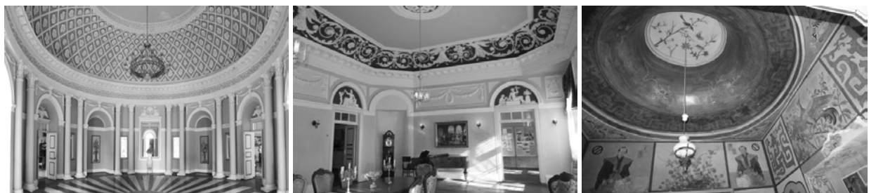
Рис. 3. Інтер’єр палацу: 1 – вітальня (Блакитна зала); 2 – велика (Червона) зала; 3 – Японський кабінет (фото автора, 2014 р.)

Палац має анфіладне планування. До наших днів частково вціліли палацові інтер’єри, що вражали колись своєю розкішшю гостей цієї садиби. Зали палацу були оформлені зі смаком й оригінальністю: стеля прикрашена ліпниною, стіни – розписами. У наші дні відвідувачам демонструють Блакитний, Великий, Римський зали й Опочивальню, а також родзинку палацу – Японський зал. Стіни кабінету розписано під японський стиль, з використанням характерних образів: самураїв, драконів, гілок сакури [4, с. 67].