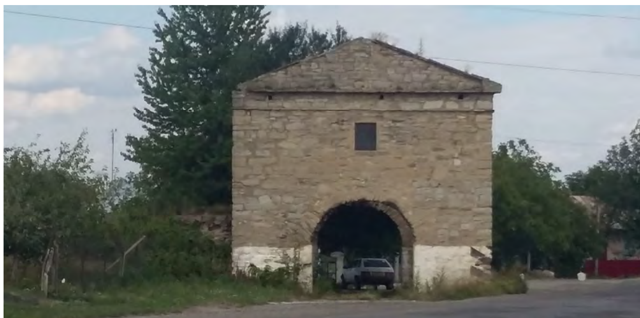
Рис. 2. Збережений фрагмент історичної фортеці “Окопи Святої Трійці” XVII – XVIII ст. Кам'янецька брама. 2016 р.