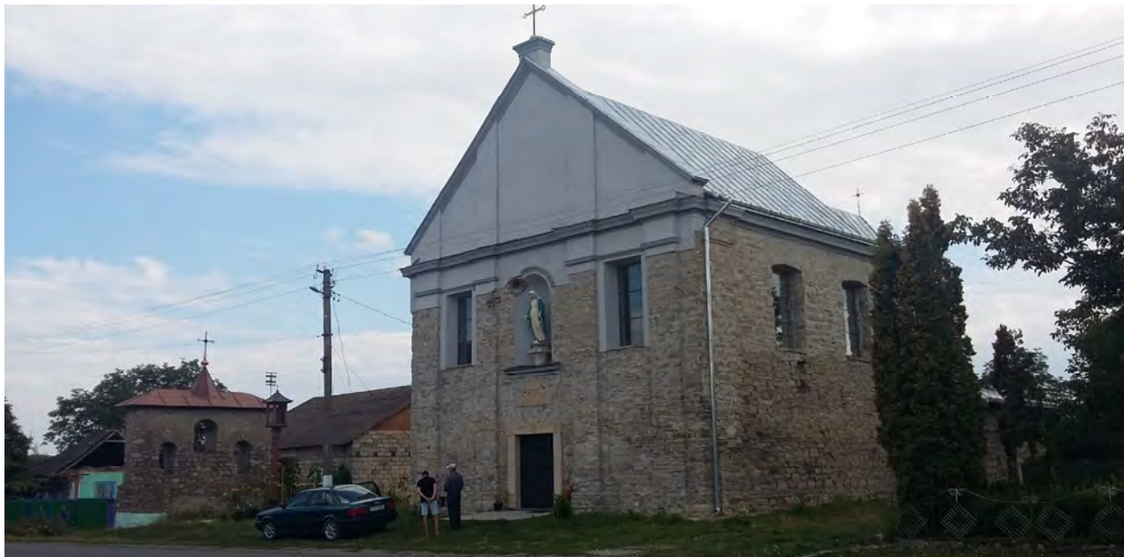
Рис. 4. Збережений частково реставрований костел Св. Трійці XVII ст. у с. Окопи (фото автора, 2016 р.)

Сьогодні склалась така ситуація, що колишня історична фортеця в Окопах, як і інші об'єкти (наприклад, замок XVII ст. у с. Чернелиця Івано-Франківської обл., фортеця у с. Єзупіль XVII ст. Івано-Франківської обл., місто-фортеця Маріямпіль XVII ст. Івано-Франківської обл. [13]) майже повністю невідомі для суспільства, оскільки рідко виникає можливість у той чи інший спосіб представити їхні збережені фрагменти на огляд широкому загалу глядачів. Також такі містобудівні утворення не мають статусу пам'ятки, а отже, не охороняються належно.