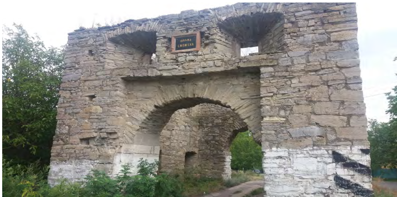
Рис. 1. Збережений фрагмент історичної фортеці “Окопи Святої Трійці” XVII – XVIII ст. Львівська брама. 2016 р.

На цьому етапі розвитку із усіх складових фортифікаційної системи частково збереженими є муровані з кам'яних блоків стіни двох в'їзних брам (рис. 1, 2) і фрагмент сторожової вежі, збережені у вигляді значних перепадів рельєфу фрагменти бастионів та куртин.