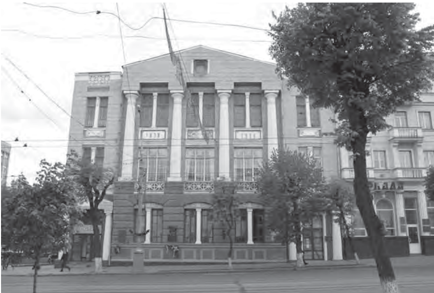
Рис. 3. Вінницька торгово-промислова палата, вул. Соборна, 67.