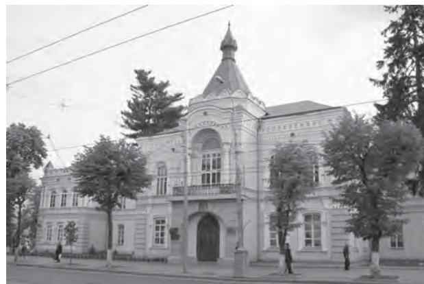
Рис. 2. Вінницький торгово-економічний інститут, вул. Соборна, 87. Фото автора 2016 р.

Наприкінці XIX ст., завдяки низці чинників, розпочалися важливі перетворення міського середовища: запроваджено загальне планувальне поєднання частин міста та поступова заміна дерев'яних та валькових будинків кам'яними; які за короткий термін змінили обличчя міста.