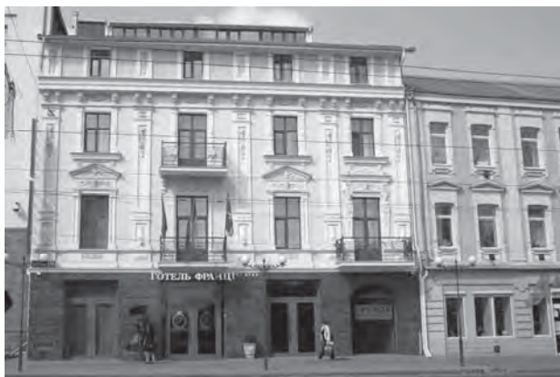
Рис. 1. Готель “Франція”, вул. Соборна, 34.

Наслідкування давньоруської та візантійської форми набули своє відображення в архітектурі будівлі реального училища (нині Вінницький торгово-економічний інститут по вул. Соборній, 87). Споруджена до 1888 р. за проектом архітектора М. Чекмарьова, коштом купця Ц. Вайнштейна. У 1889 р. з боку сучасної вул. Театральної до основного будинку училища зроблено прибудову за проектом архітектора В. Краузе. Двоповерхова цегляна будівля має три ризаліти, що завершуються шатровим покриттям. Центральний ризаліт має виступаючий об'єм головного вхідного тамбуру й оформлений по другому поверху портиком з двома колонами, підкресленими ентазисом та завершеними яйцеподібними капітелями. Кути ризалітів підкреслені рустами та лопатками. Вікна другого поверху мають напівциркульні аркові перемички. Планування приміщень коридорне. Класні кімнати світлі, просторі [5] (рис. 2).