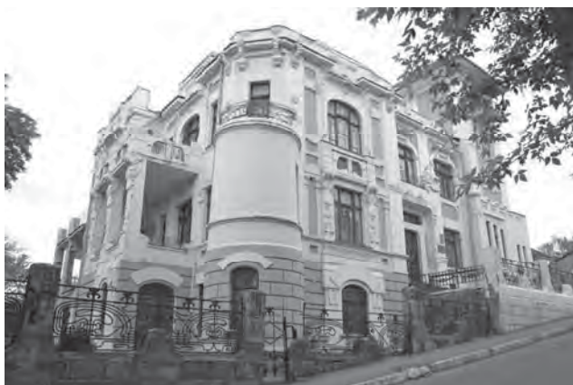
Рис. 5. Будівля Департаменту архітектури та містобудування Вінницької міської ради, вул. Пушкіна, 38.