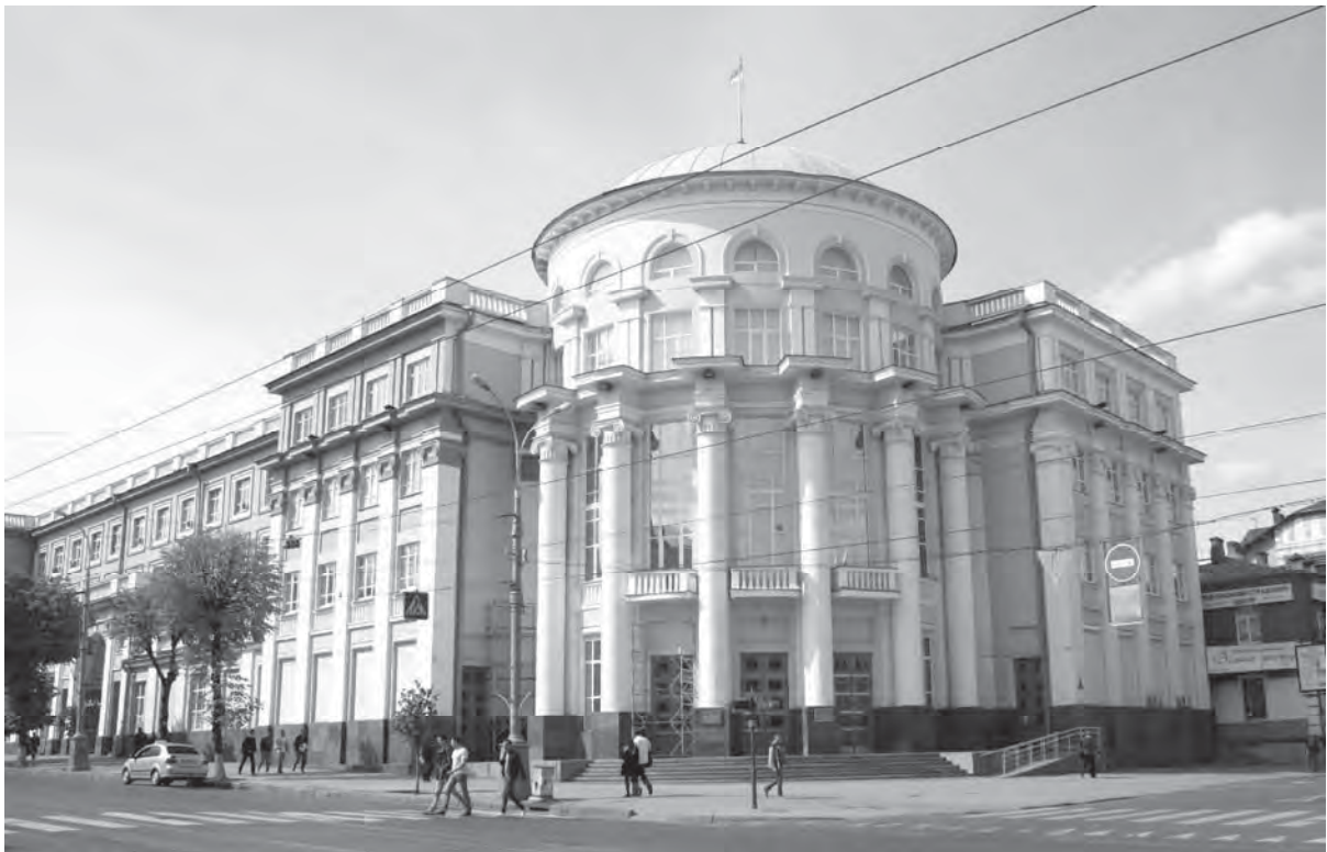
Рис. 9. Будівля Вінницької облради та облдержадміністрації, вул. Соборній, 70, 72. Фото автора 2016 р.

Велична будівля Будинку організацій (1936–41, 1946–49 рр.) по вул. Соборній, 70, 72, є прикладом неокласичної архітектури (нині будівля Вінницької облради та облдержадміністрації). Адміністративний будинок, що став однією з домінант правобережного міста, будували за проектом та консультацією П. Ф. Альошина архітектори С. І. Рабін, Л. О. Черленіовський. Модернізований “великий” іонічний ордер, у якому вирішено архітектоніку фасадів, являє собою шість колон на три поверхи півкруглого ризаліту і ритм відповідних пілястр бічних прямокутних ризалітів, що фланкують кутову форму та напівкруглий ганок. Великий кутовий об’єм завершено напівсферичним куполом півкруглого ризаліту із головним входом, має чотири основні поверхи, п’ять рівнів (включно з рівнем балкону-антресолі у верхній залі засідань), просторий підвал із початковими функціями бомбосховища [4] (рис. 9).