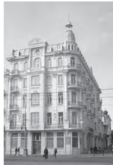
Рис. 4. Готель “Савой”, вул. Соборна, 48. Фото автора 2016 р.

Садиба капітана О. Четкова (1910 р.), вул. Пушкіна, 38 – один із найдовершеніших та найдорожчих будинків того часу у місті. Автор проекту модернової будівлі “віденської сецесії” – відомий архітектор В. П. Листовничий. Триповерхова з підвалом, потинькована. В оформленні фасадів домінують декоративні форми і деталі, типові для модерну: великі аркові та круглі