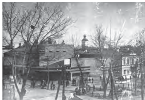
Рис. 8. Кінотеатр ім. М. Коцюбинського, вул. Соборна, 52. Фото 1931 р. [11]

Засоби нової архітектури знаходили найліпше втілення в архітектурі виробничих споруд. У 1920–1930 рр. збудовано сірчаноокислотний цех суперфосфатного заводу, м'ясокомбінат, державну швейну фабрику, кондитерську фабрику, плодозавод, паротурбінну електростанцію та інші [10].