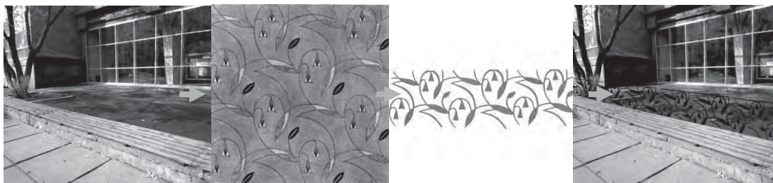
Рис. 2. Проектна пропозиція трансформації та інтегрування графічної схеми В. Кричевського у ландшафтне середовище (вик. С. Гаврисьо, ст. ДЗ-42, каф. ДОА, 2016 р.)

Чіткі силуети, “графічність” та структура орнаментальних схем В. Кричевського однаково добре надаються для трансформування у цікаві елементи предметного дизайну для урбаністичного, ландшафтного простору: транспарентні решітки, загорожі, художнє ковальство, об’ємно-просторові арт-об’єкти, світильники, вуличне освітлення тощо (рис. 2).