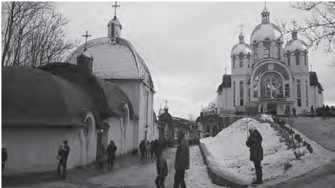
Рис. 7. Церква Пресвятої Євхаристії (зліва) в Марійському Духовному центрі, с. Зарваниця