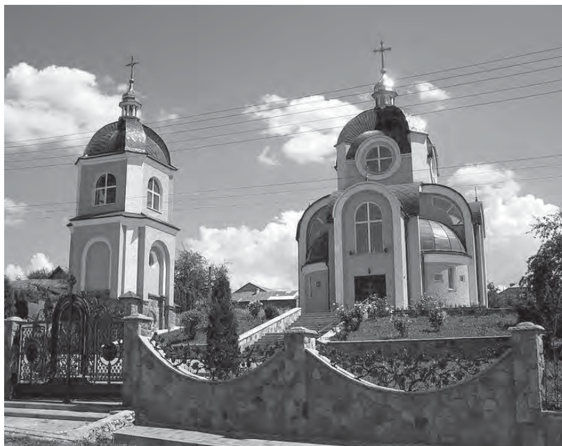
Рис. 2. Церква Блаженного св. Миколая Чарнецького, с. Млинівці Зборівського району Тернопільської області