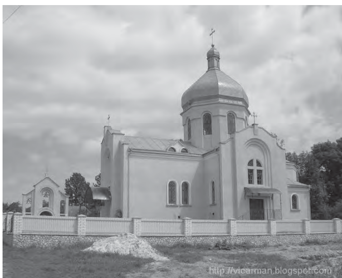
Рис. 3. Церква святого Миколая с. Цебрів у с. Підгороднє Тернопільського р-ну