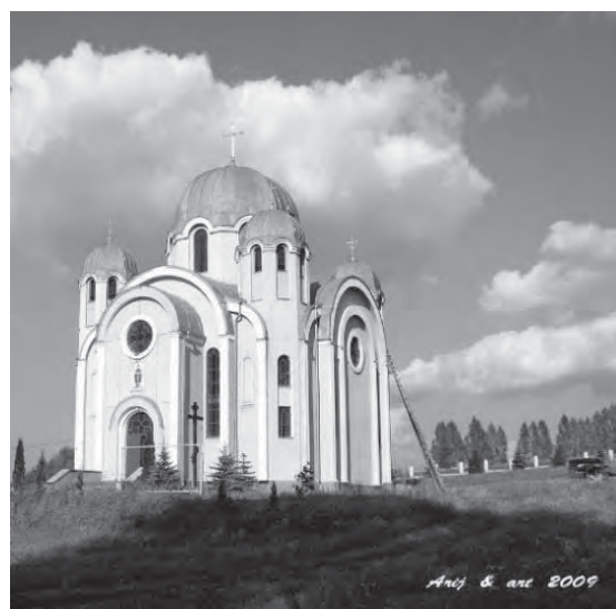
Рис. 4. Церкви Різдва Пресвятої Богородиці Тернопільська область