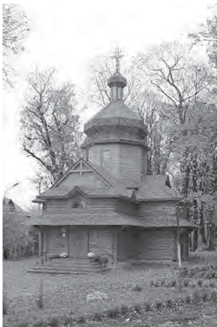
Рис. 1. Церква Зарваницької Матері Божої, м. Тернопіль

До іншої стильової тенденції розвитку сучасної сакральної архітектури в творчості М. Нетриб'яка можна віднести використання принципів дерев'яного храмубудування. Так дерев'яна церква Зарваницької Матері Божої (рис. 1), що збудована в "Старому парку", не є характерною для Тернополя. Вона органічно вписалася у краєвид із старими деревами, та одноповерховими приватними будинками. Храм збудували у 2013 році. Сакральна будівля збудована з карпатської смереки, що нагадує традиції гуцульських церков. Історично склалося, що церквам Тернопілля надавали оборонний характер, їх будували переважно з каменю. Отже, церква з "Старого парку" внесла карпатський дух у міський ландшафт Тернополя.