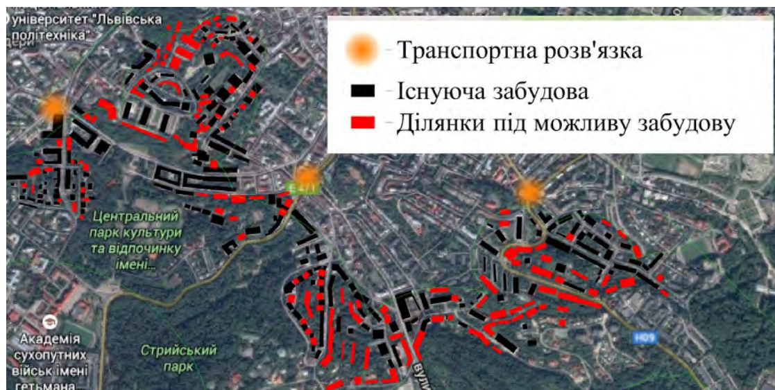
Рис. 2. Гіпотетична мапа деградації частини Франківського і Галицького районів Львова (автор Р. Доцяк)

Хоча ця мапа зачіпає тільки найнаближеніші до центральної частини території району та фіксує тільки один із етапів передбачуваного процесу, очевидною є підсумкова втрата ним ознак, які початково були мотивом для розвитку житлової забудови. Зелені та екологічні зони поступово зникають, а житлова забудова в 6–12 поверхів змінює вигляд містобудівної тканини та ландшафтного представлення району з домінуванням псевдоабстрактних форм, які не властиві історичній ідентичності та духу міста.