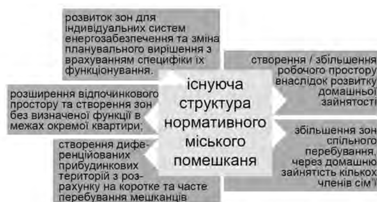
Рис. 4. Перелік розширених характеристик у постіндустріальному міському помешканні

частіше перебування тут мешканців із прилеглих будинків; г) розширення індивідуального та відпочинкового простору та створення зон без визначеної функції у межах окремої квартири; д) розвиток зон для індивідуальних систем енергозабезпечення та зміна планувально-просторового вирішення помешкання з врахуванням специфіки їх функціонування (рис. 4).