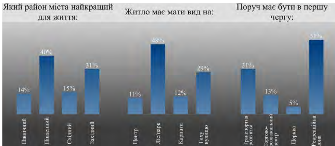
Рис. 1. Результати опитування серед студентів-архітекторів щодо ознак ідеалу міського помешкання