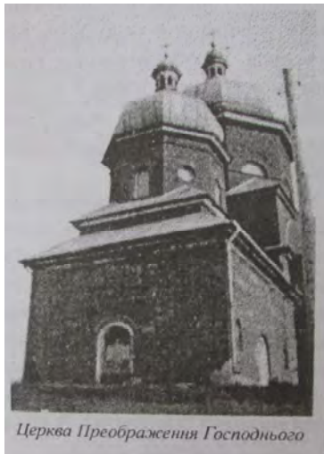
Рис. 1. Церква Преображення Господнього