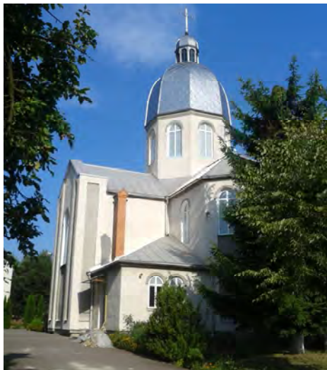
Рис. 3. Сучасна церква