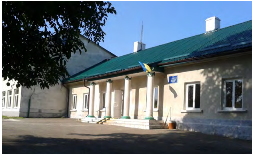
Рис. 2. Сучасна Скнилівська школа

Історично склалося так, що землі, на яких знаходиться школа, були викуплені у 1905 р. Митрополитом Андреем Шептицьким і саме перед Другою світовою війною він заснував жіночий монастир і школу при ньому для навчання дітей скнилівчан. Війна зруйнувала ці плани, проте сьогоднішня Скнилівська школа знаходиться саме на цих благодатних землях.