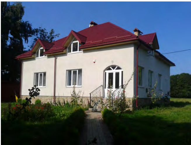
Рис. 5. Плебанія з катехитичною школою

архітектурно-планувальної організації та художньо-стилістичного вирішення цього комплексу. У перспективі заплановано спорудити будівлю духовно-просвітницького та реколекційного призначення, а також будівлю дитячого садочка. На рис. 6 показано схему генплану проектного Духовно-просвітницького центру ім. Митрополита Андрея Шептицького.