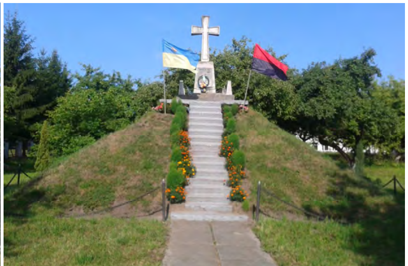
Рис. 4. Могила-пам'ятник полеглим за волю України

Отже, у повоєнні роки у центрі с. Скнилів на землях, придбаних Митрополитом Андреем Шептицьким, сформувався духовно-просвітницький комплекс, до якого увійшли: церква, дзвіниця, вхідна арка, плебанія з катехитичною школою, могила-пам'ятник, 8-річна загально-освітня школа, дитячий майданчик, фруктовий сад та старі насадження лип по периметру. Стрімкий духовний та соціально-культурний розвиток громади с. Скнилів ставить нові вимоги щодо