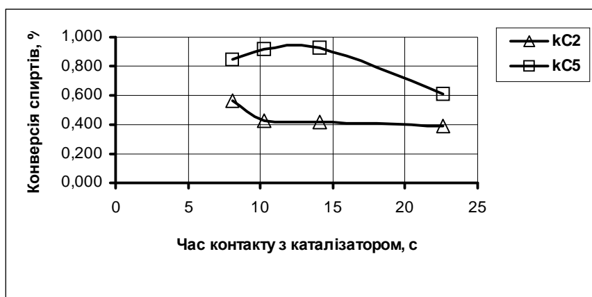
Рис. 3. Залежність конверсії етилового та ізоамілового спиртів від часу контакту з каталізатором за їх співвідношення 1:2 і температури 593 К

Для визначення впливу часу контакту на конверсію та вихід цільових продуктів проводились досліди за постійної температури 593 К та співвідношення етилового та ізоамілового спиртів – 1:2. За результатами досліджень можна зробити висновок, що час контакту вихідної суміші з каталізатором на перетворення етилового спирту майже не впливає і мало впливає на конверсію ізоамілового спирту (рис. 3).