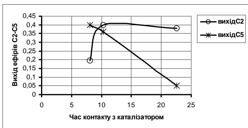
Рис. 4. Залежність виходу діетилового і етил-ізоамілового ефірів від часу контакту з каталізатором етилового та ізоамілового спиртів за співвідношення останніх 1:2 і температури процесу дегідратації 593 К

Якщо проаналізувати вплив часу контакту на вихід цільових продуктів, то бачимо, що вихід діетилового ефіру зростає з підвищенням часу контакту і досягає максимального значення за t=10-15 с, а вихід етил-ізоамілового ефіру з підвищенням часу контакту зменшується (табл. 1, рис. 4).