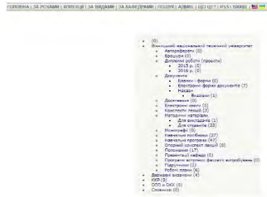
Рис. 2 Колекції навчального репозиторію

Такий інструментарій разом з онлайн-спільнотою створення нормативних та розпорядчих документів за допомогою інструментів колективної взаємодії дозволить збільшити продуктивність праці всіх учасників організації освітньої діяльності.