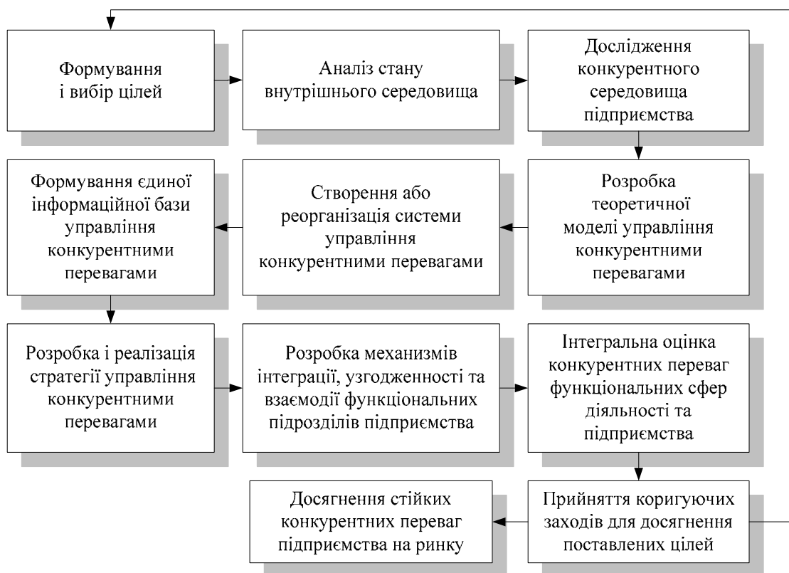
Рис. 3. Логіко-структурна модель управління конкурентними перевагами підприємства