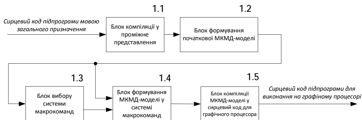
Рис. 2. Блок формування сирцевого коду для графічного процесора

Блок генерування сирцевого коду для графічного процесора перетворює виокремлену частину коду для виконання графічним прискорювачем (рис. 2). Блок автоматично враховує всі особливості графічного процесора, і згенерований ним код максимально завантажує його функціональні елементи для досягнення високої продуктивності.