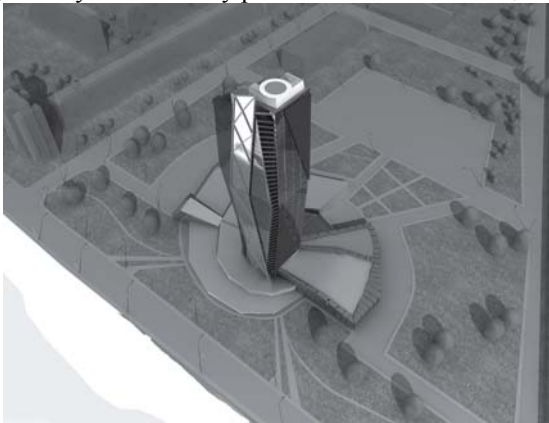
Рис.2 Проект багатофункціонального центру по вулиці Набережній Дніпровській у м. Києві. Перспектива з висоти платиного польоту.

Формування концепції планування культурного центру складалось на основі спіральної форми, яка зустрічається у природі та використовувалась людством у всі часи та у різноманітних комбінаціях.