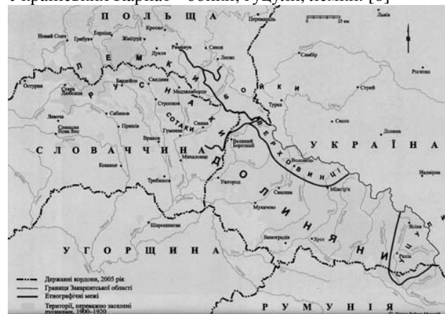
Етнографічні межі розселення русинів за П.Е.Магочем

цих груп згладжуються, звужується сфера їх впливу і окремі з них перестають існувати. Етнографічні групи українського етносу зараз найкраще збереглися в межах Українських Карпат та Закарпаття. Найкраще зберегли свої особливості етнографічні групи горян Українських Карпат - бойки, гуцули, лемки. [8]