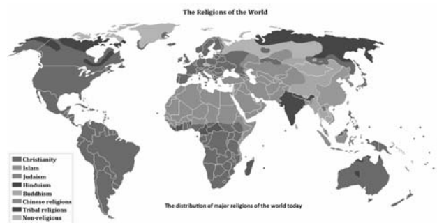
Рис.5. Україна на карті релігій світу [5]

Культура Київської Русі спиралась на народні елементи. Після X ст. (після прийняття християнства), поширився візантійський вплив, що виявлявся в техніці ремесел, мистецтві, науці, письменстві, праві. Вплив Скандинавії позначився на державній організації і військовій справі. У Західних землях панували західноєвропейські впливи, що поширилися в архітектурі, міському праві, вживанні латинської мови, толерантному ставленні до католицької церкви, і йшли через Угорщину та Німеччину. Дивлячись на сучасну карту релігій світу видно, що Україна повністю належить до європейських країн.