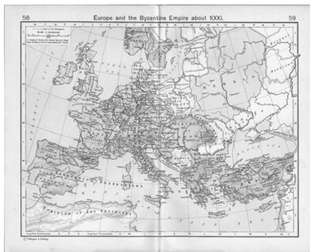
Рис.1. Київська Русь – складова частина європейського простору X-XI ст. [6]

князя Болеслава Хороброго. Та найбільшим досягненням Володимира було запровадження християнства (хоч християнство на Русі існувало і до нього – княгиня Ольга була християнкою). Оскільки, в той час вся Європа була християнською, щоб увійти в коло європейських народів Володимир 988 року охрестив Київську Русь, а сам одружився з візантійською царівною Анною. Завдяки Володимиру Україна стала пов'язана з християнським Заходом, а не з ісламським Сходом.