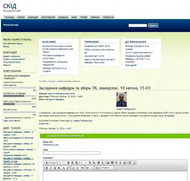
Рис. 1. Зображення внутрішнього сайту кафедри СКІД

Однією із переваг використання внутрішнього сайту викладачами кафедри СКІД є спільні опрацювання та формування документів, що є важливим аспектом в навчальному процесі.