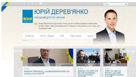
Рис.3. Приклад веб-сайту

Приклад веб-сайту народного депутата, який активно підтримується та демонструє відносно якісний дизайн та інформаційну архітектуру представлено на рис.3.