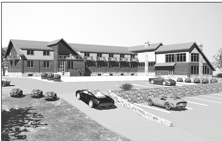
Рис. 4. Туристичний готель з рестораном. Дипломний проект Т. Данилюка. 2005 р.

Для внутрішнього транспортного сполучення між вузлами намічено використати автошлях місцевого значення Миколаїв – Сільське – Розділ, зовнішні зв'язки забезпечує автошлях Київ – Львів – Чоп. Невелика віддаль від Львова, (близька 30–40 км), гарантує доступність для одно-, дводенних туристичних поїздок.