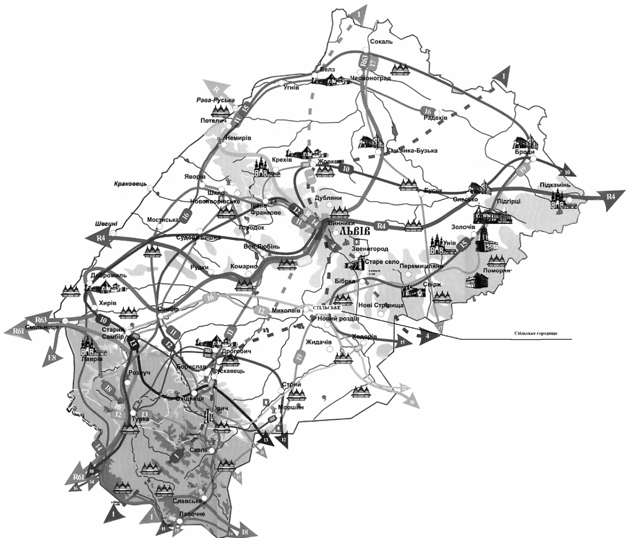
Рис. 1. Схема туристичних маршрутів Львівщини, розроблена Управлінням культури і туризму ЛОДА у 2005 р.

тільки декілька об'єктів епізодично демонструються туристам (рис. 1). Однією з причин такої ситуації є відсутність відповідної туристичної інфраструктури на території та в оточенні об'єктів археології і тому відвідання туристами часто спричиняє пошкодження культурного шару, порушення режиму охоронних територій тощо.