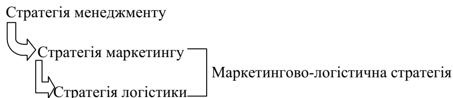
Рис. 1 Комплексне формування стратегії

Під стратегією маркетингу розуміють принципові, середньо- чи довготермінові рішення, що дають орієнтири та спрямовують певні маркетингові заходи на досягнення поставлених цілей (рис. 2).