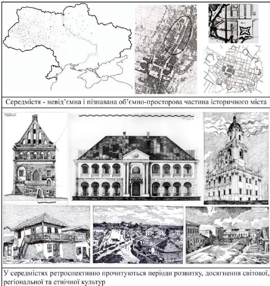
Рис. 1. Розпланування середмість та архітектурно-просторові особливості забудови.

У XIX – на початку XX ст. 65% досліджених середмість склалися із дерев'яної забудови (зрубна, каркасно-дильова, валькована, фахверкова конструкції). Мурована переважала у 15% середмість. Упродовж XIX – на початку XX ст. дерев'яну забудову замінюють мурованою (20% середмість). Внаслідок успадкованості архітектурних форм середмістя стало невід'ємною, складною і пізнаваною об'ємно-просторовою частиною поселення. Тут ретроспективно прочитуються періоди розвитку, досягнення світової, регіональної та етнічної культур, наповнених смислами, формами та знаками. (рис. 1)